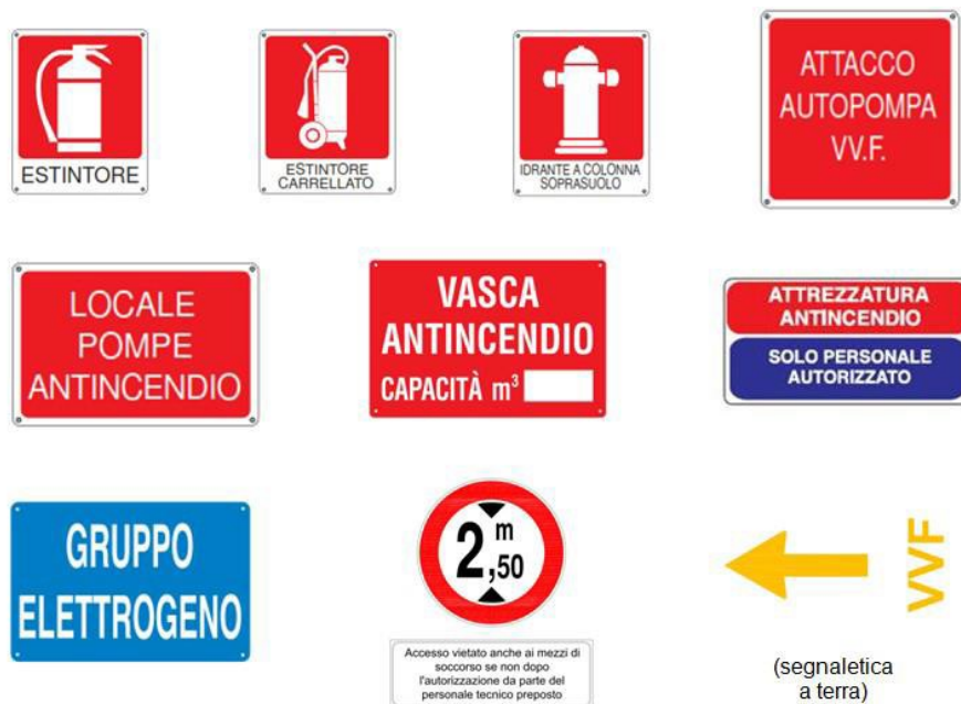
Figura 3 - Esempi di segnaletica di sicurezza