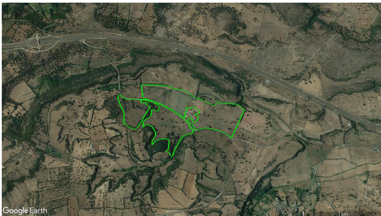
Fig. 2 – Area di progetto