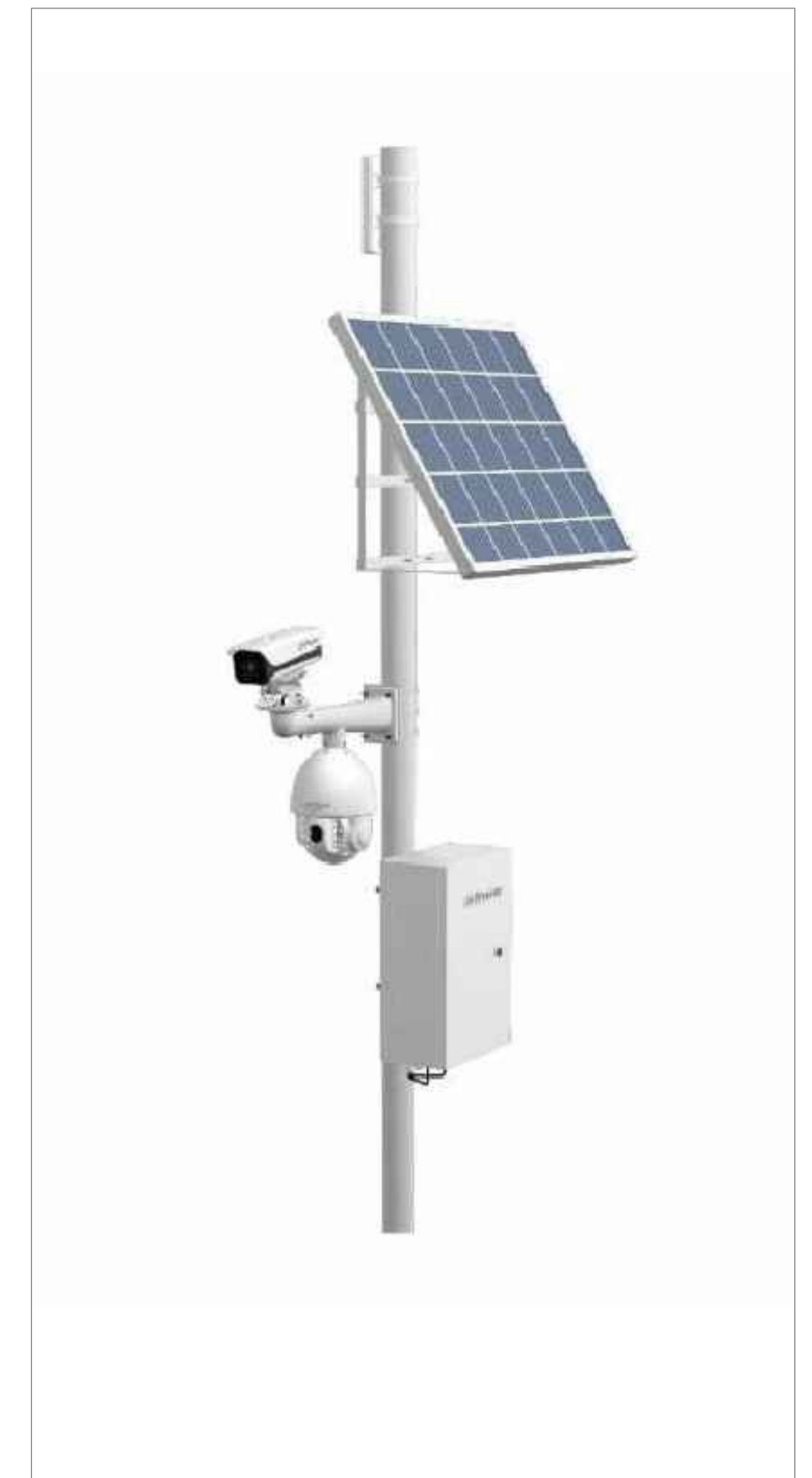
SISTEMA DI VIDEOSORVEGLIANZA