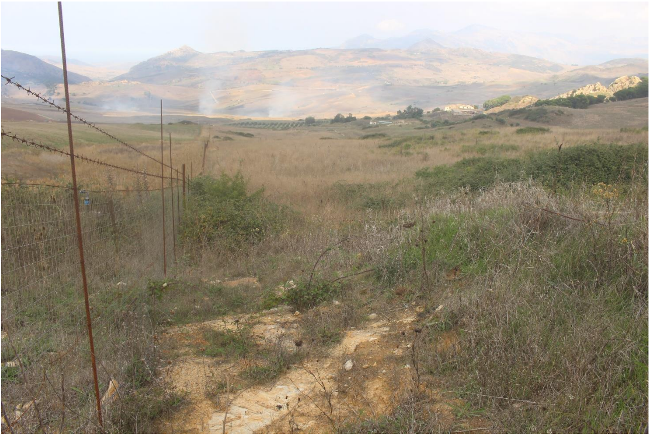
PUNTO DI VISTA FOTOGRAFICO 3