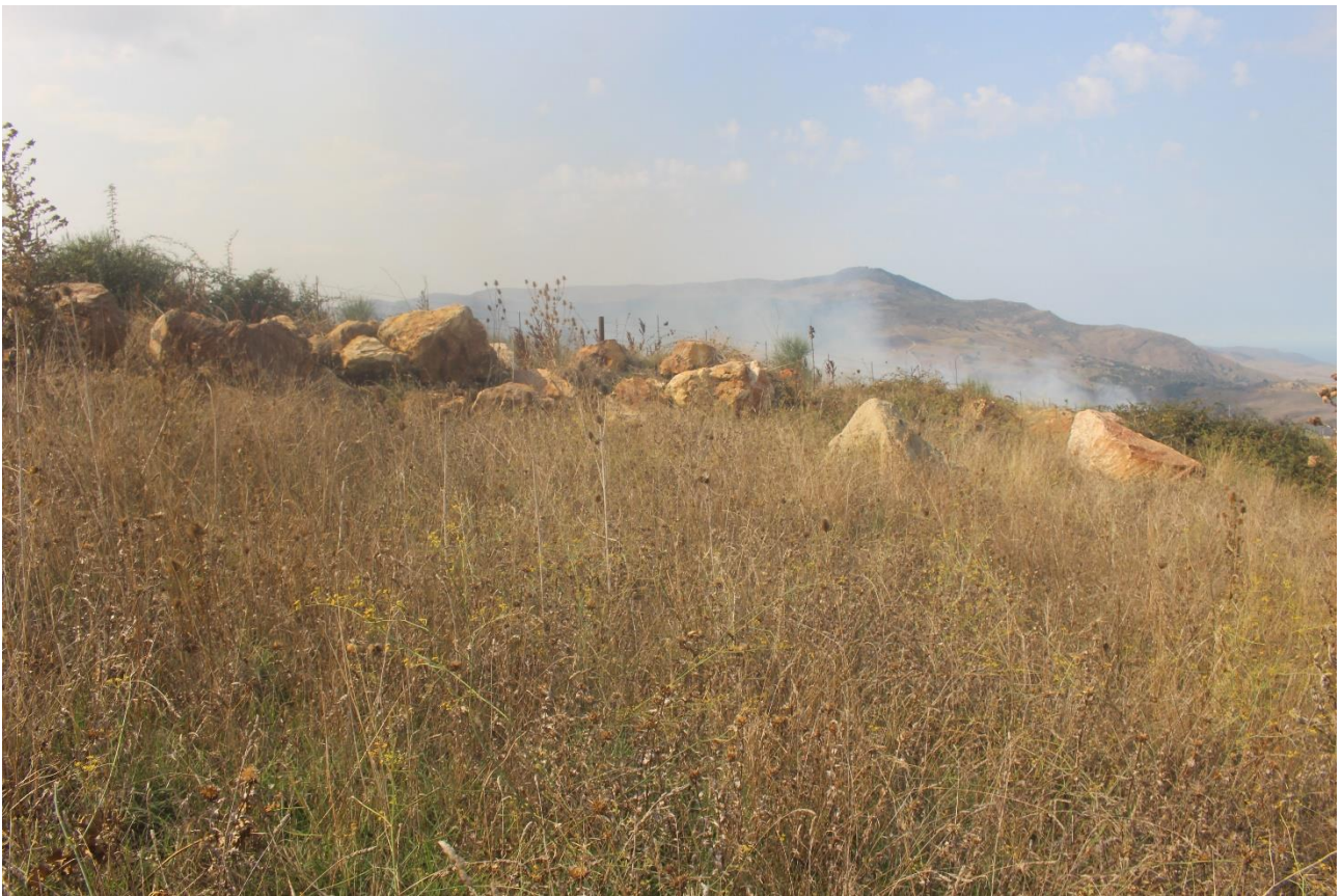
PUNTO DI VISTA FOTOGRAFICO 4