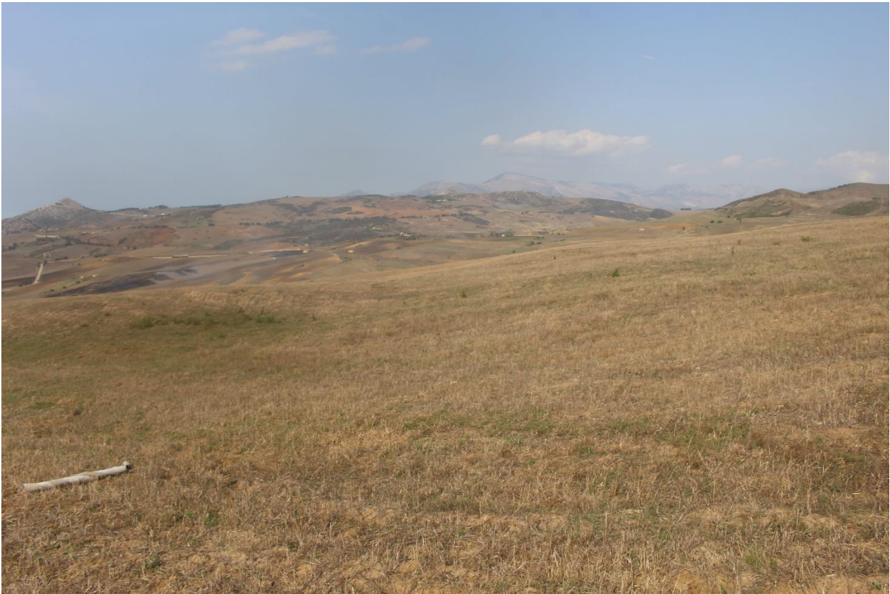
PUNTO DI VISTA FOTOGRAFICO 7