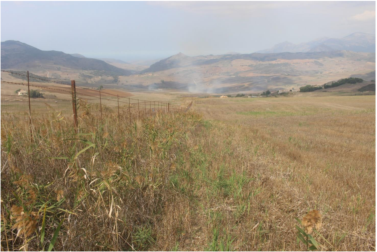
PUNTO DI VISTA FOTOGRAFICO 1