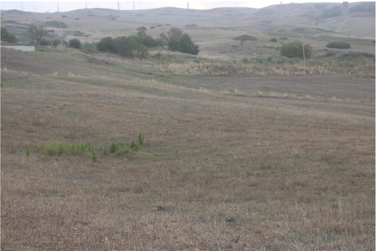
PUNTO DI VISTA FOTOGRAFICO 6