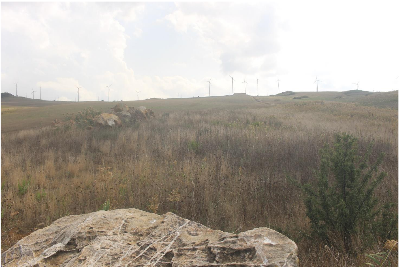
PUNTO DI VISTA FOTOGRAFICO 2