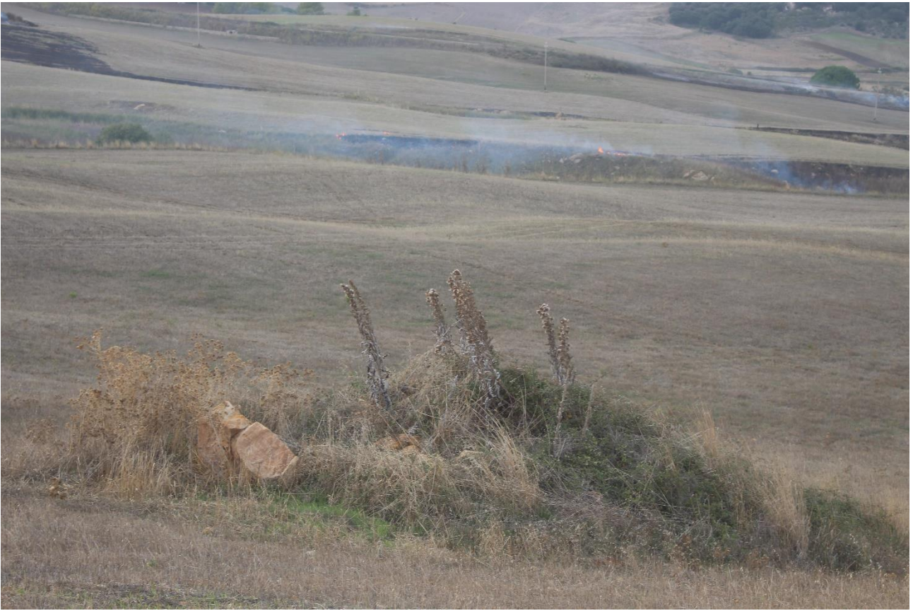
PUNTO DI VISTA FOTOGRAFICO 5