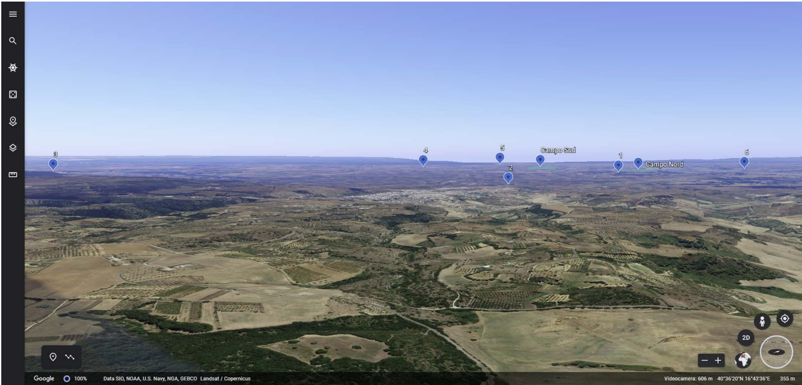
Inquadramento territoriale di progetto VISIBILITA' DELLE AREE DI PROGETTO - Punto di vista n.2 - STRADA PROVINCIALE N.4 – Da Nord ad 8 km di distanza - 130 mt s.l.m.