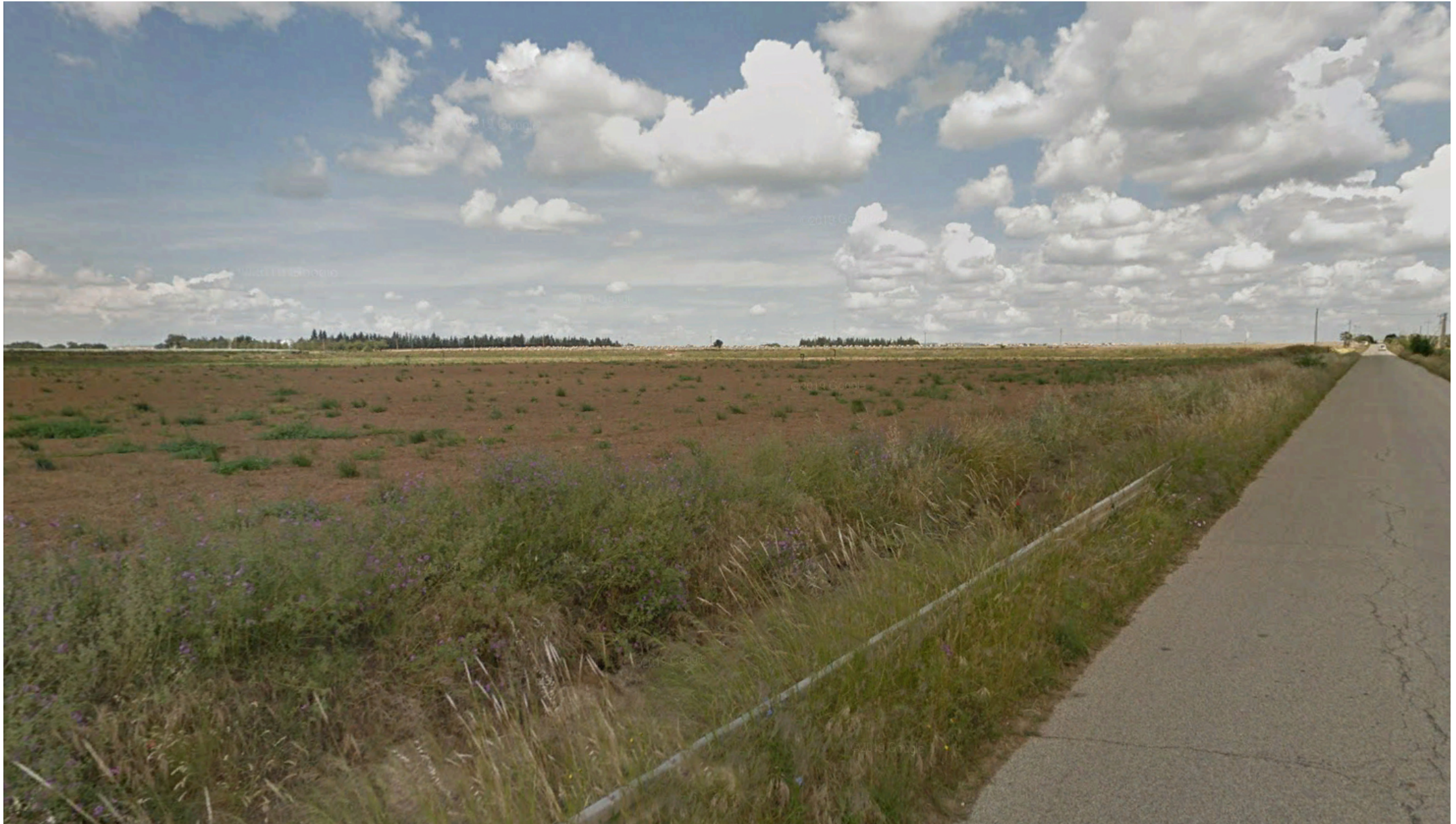
Inquadratura territoriale di progetto VISIBILITA' RAVVICINATA DEL PARCO - Ante e Post Operam - Campo Nord