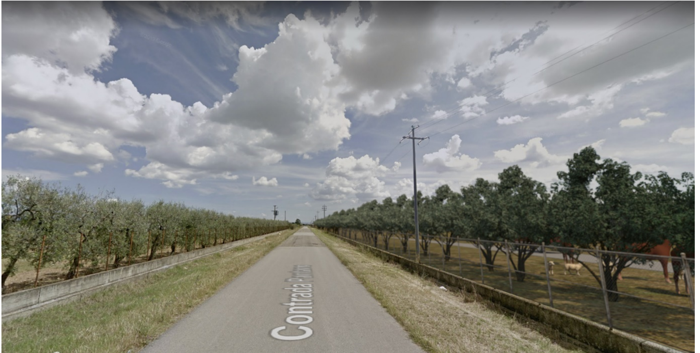
Inquadratura territoriale di progetto VISIBILITA' RAVVICINATA DEL PARCO - Ante e Post Operam - Campo Sud