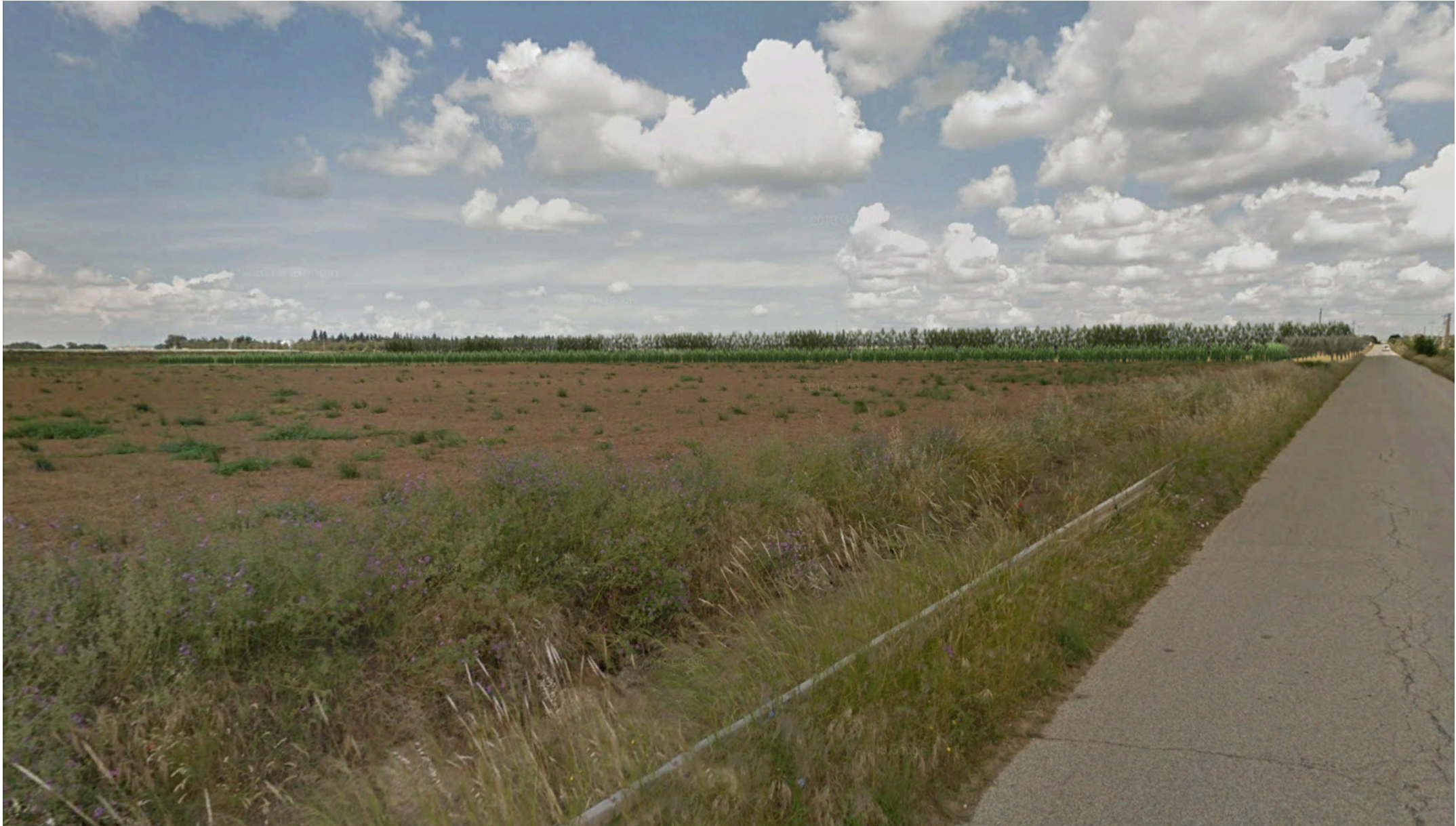
Inquadratura territoriale di progetto VISIBILITA' RAVVICINATA DEL PARCO - Ante e Post Operam - Campo Nord