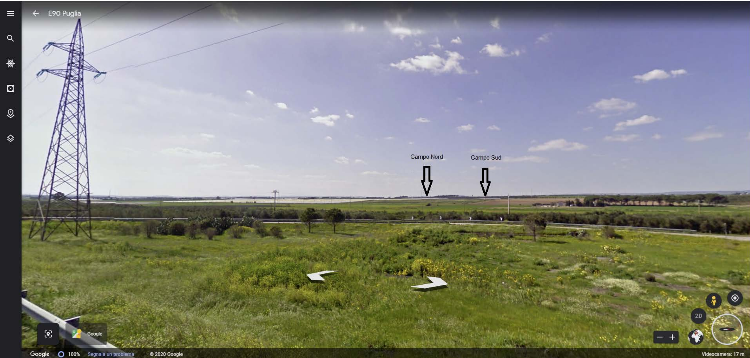
Inquadratura territoriale di progetto VISIBILITA' DELLE AREE DI PROGETTO - Punto di vista n.5 - STRADA STATALE 106 - Da Est a 5 km di distanza - 10 mt s.l.m.