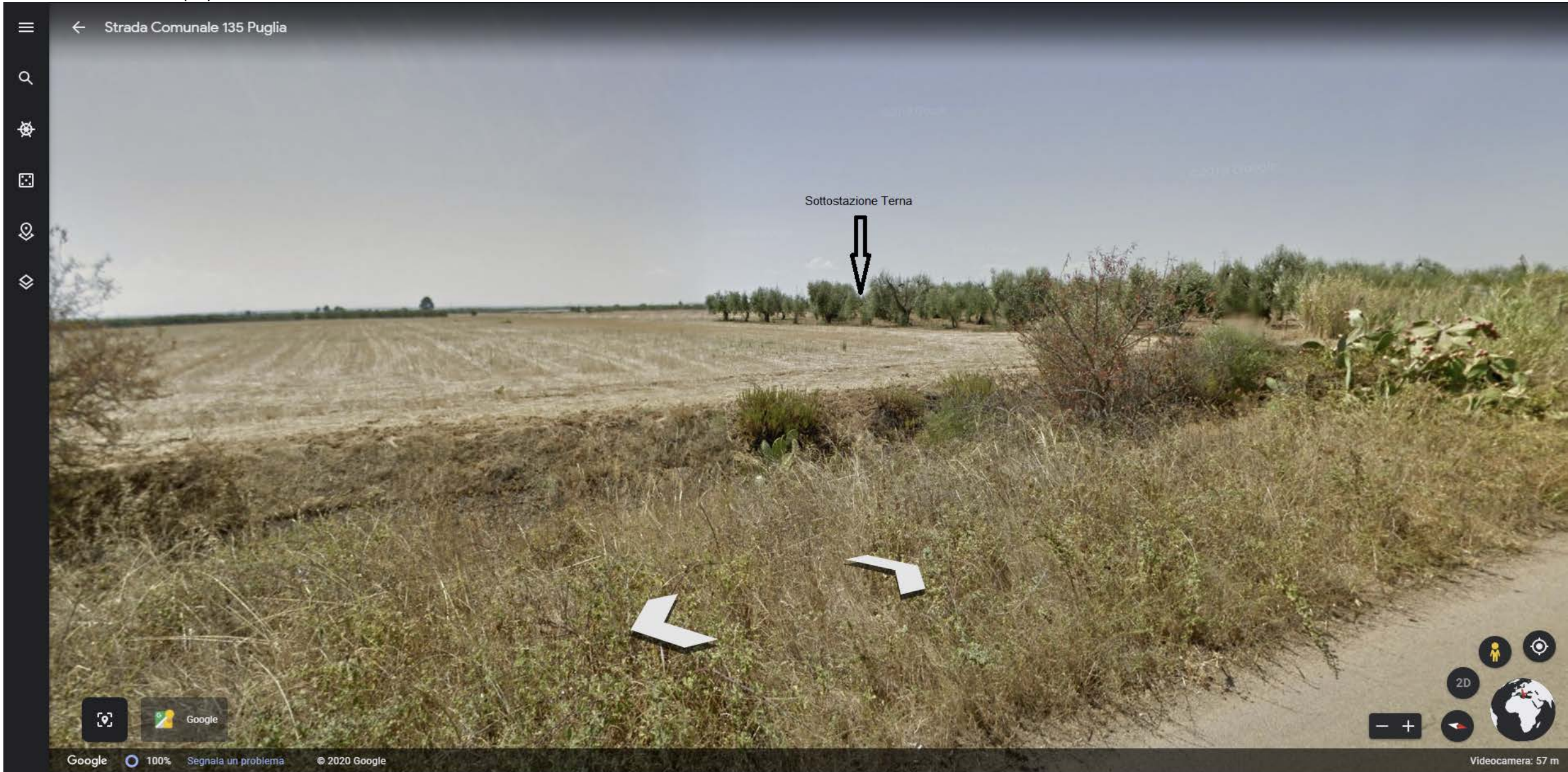
Inquadratura territoriale di progetto VISIBILITA' DELLE AREE DI PROGETTO - Punto di vista n.7 - STRADA COMUNALE n.135 - Da Ovest ad 1 km di distanza - 53 mt s.l.m.