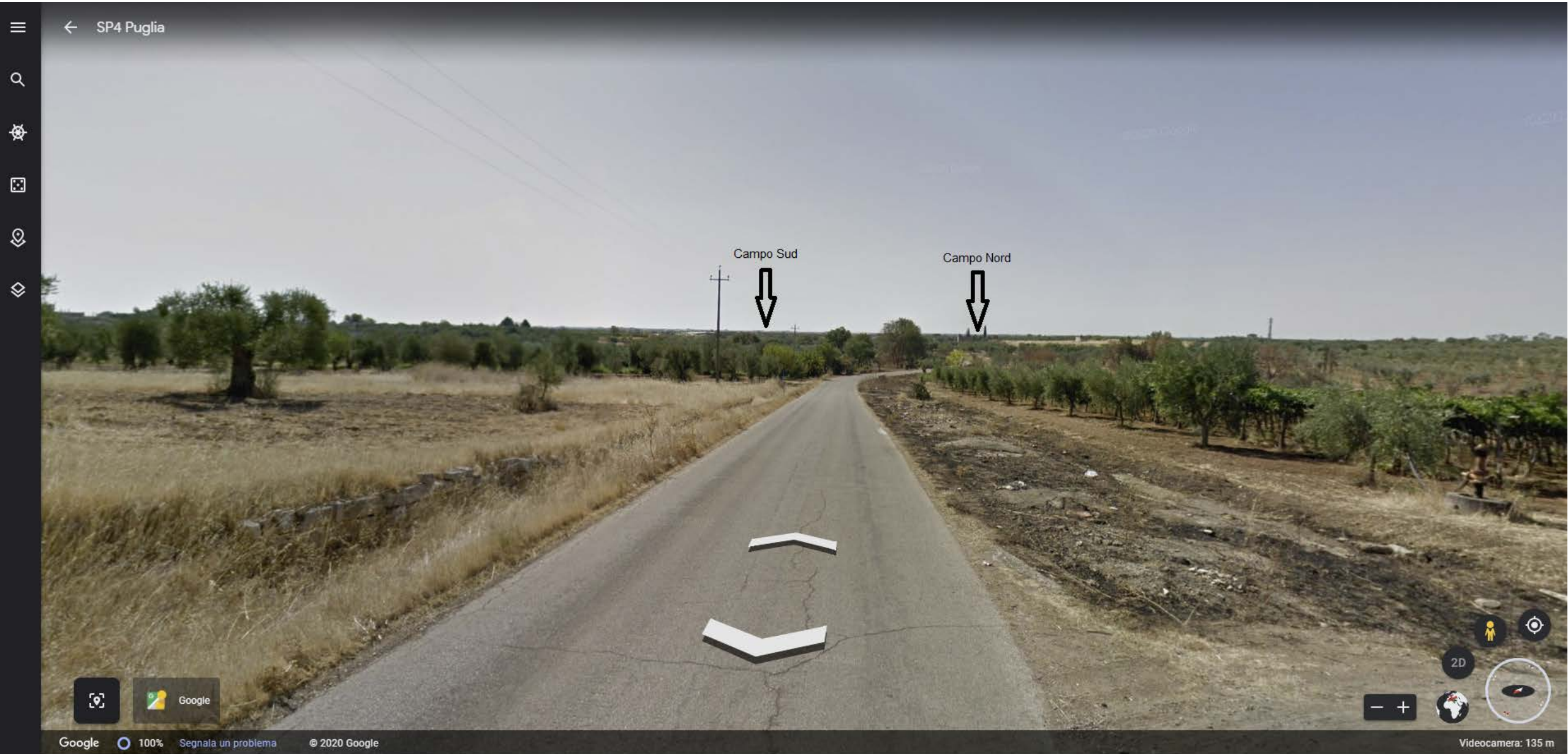
Inquadramento territoriale di progetto VISIBILITA' DELLE AREE DI PROGETTO - Punto di vista n.2 - STRADA PROVINCIALE N.4 – Da Nord ad 8 km di distanza - 130 mt s.l.m.