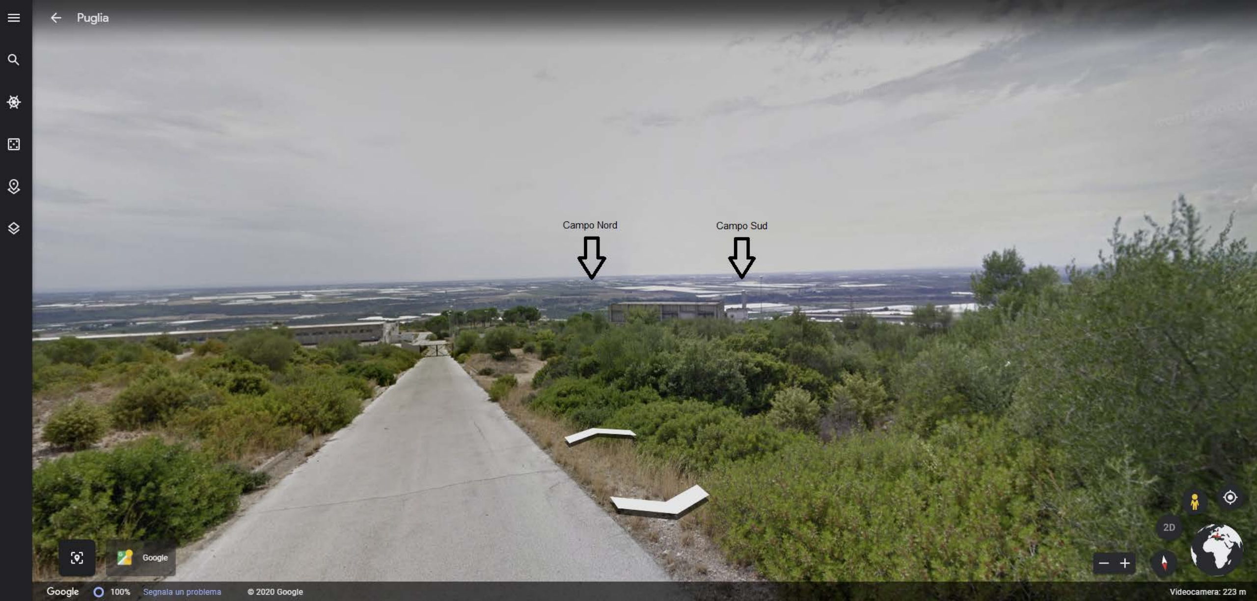
Inquadramento territoriale di progetto VISIBILITA' DELLE AREE DI PROGETTO - Punto di vista n.3 - STRADA PROVINCIALE N.16 - Da Nord Est a 19 km di distanza - 208 mt s.l.m.