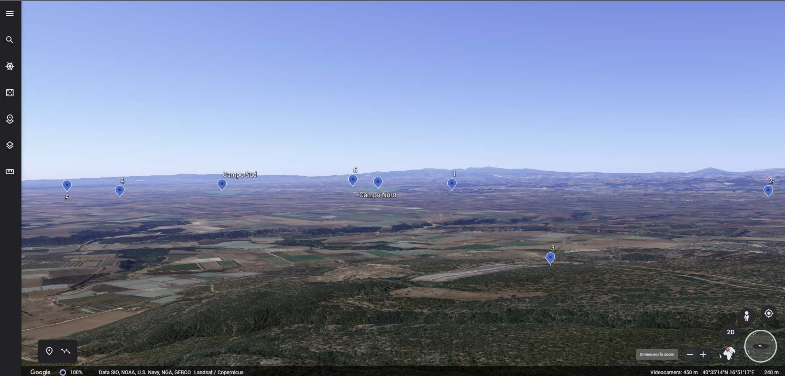
Inquadratura territoriale di progetto VISIBILITA' DELLE AREE DI PROGETTO - Punto di vista n.3 - STRADA PROVINCIALE N.16 - Da Nord Est a 19 km di distanza - 208 mt s.l.m.