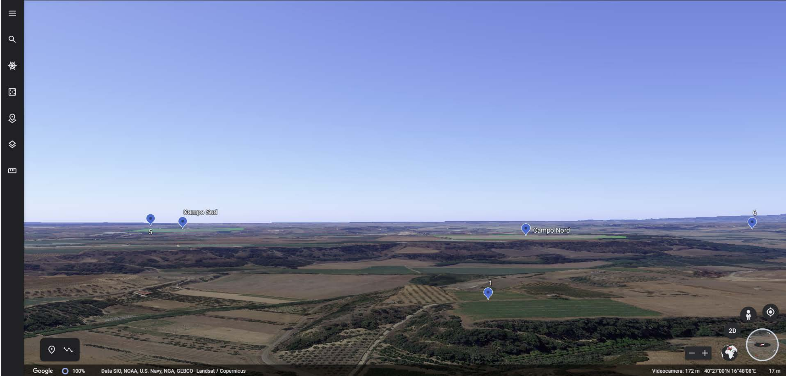
Inquadramento territoriale di progetto VISIBILITA' DELLE AREE DI PROGETTO - Punto di vista n.1 - STRADA PROVINCIALE N.4 – Da Nord a 2 km di distanza - 130 mt s.l.m.