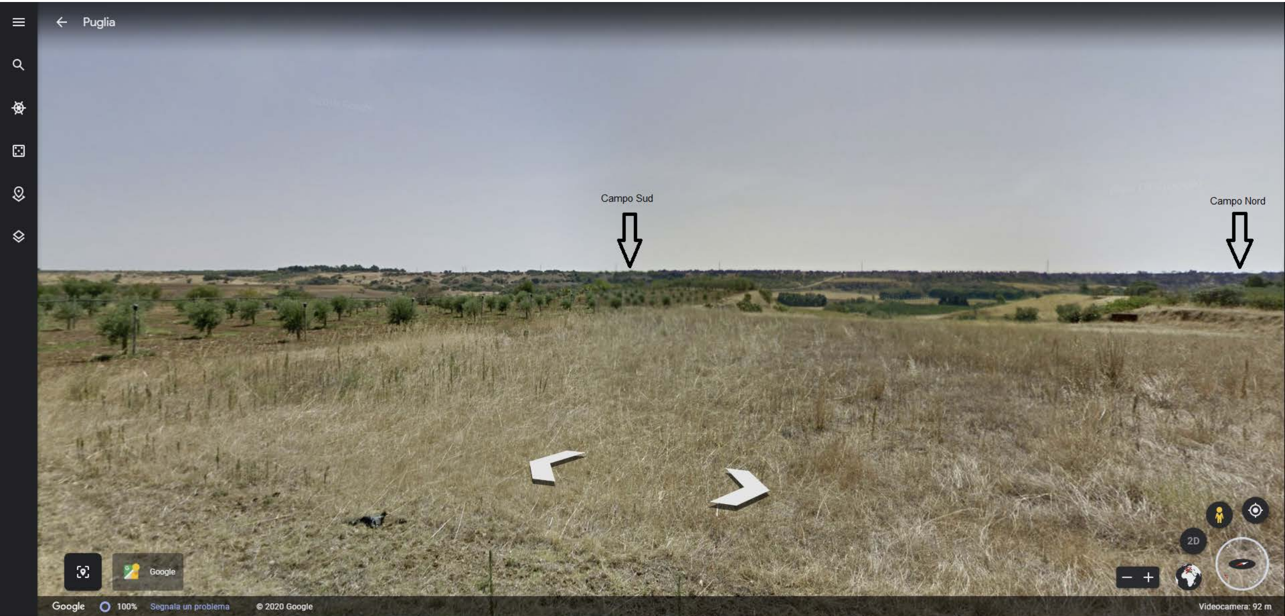
Inquadramento territoriale di progetto VISIBILITA' DELLE AREE DI PROGETTO - Punto di vista n.1 - STRADA PROVINCIALE N.4 – DA Nord a 2 km di distanza - 130 mt s.l.m.