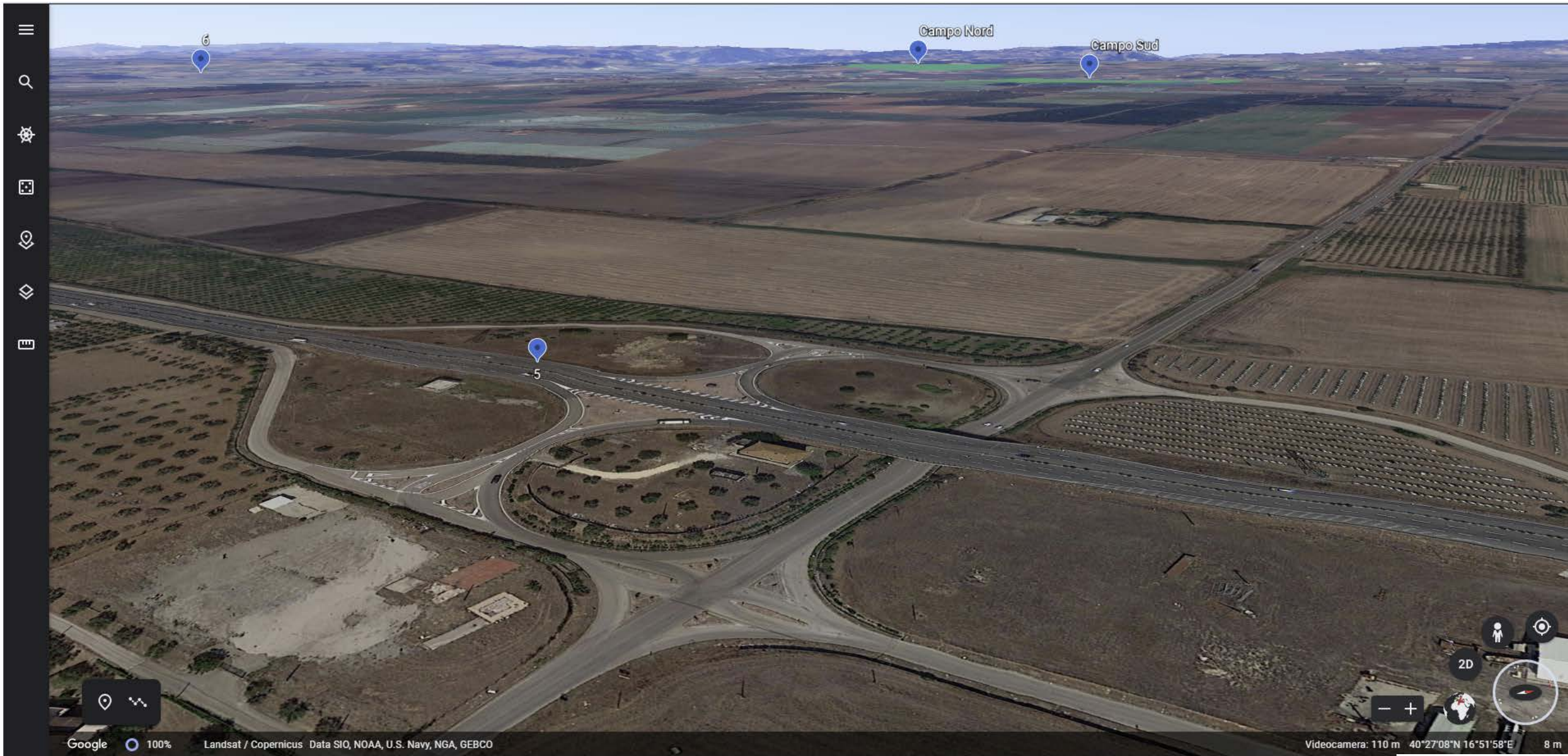
Inquadratura territoriale di progetto VISIBILITA' DELLE AREE DI PROGETTO - Punto di vista n.5 - STRADA STATALE 106 - Da Est a 5 km di distanza - 10 mt s.l.m.