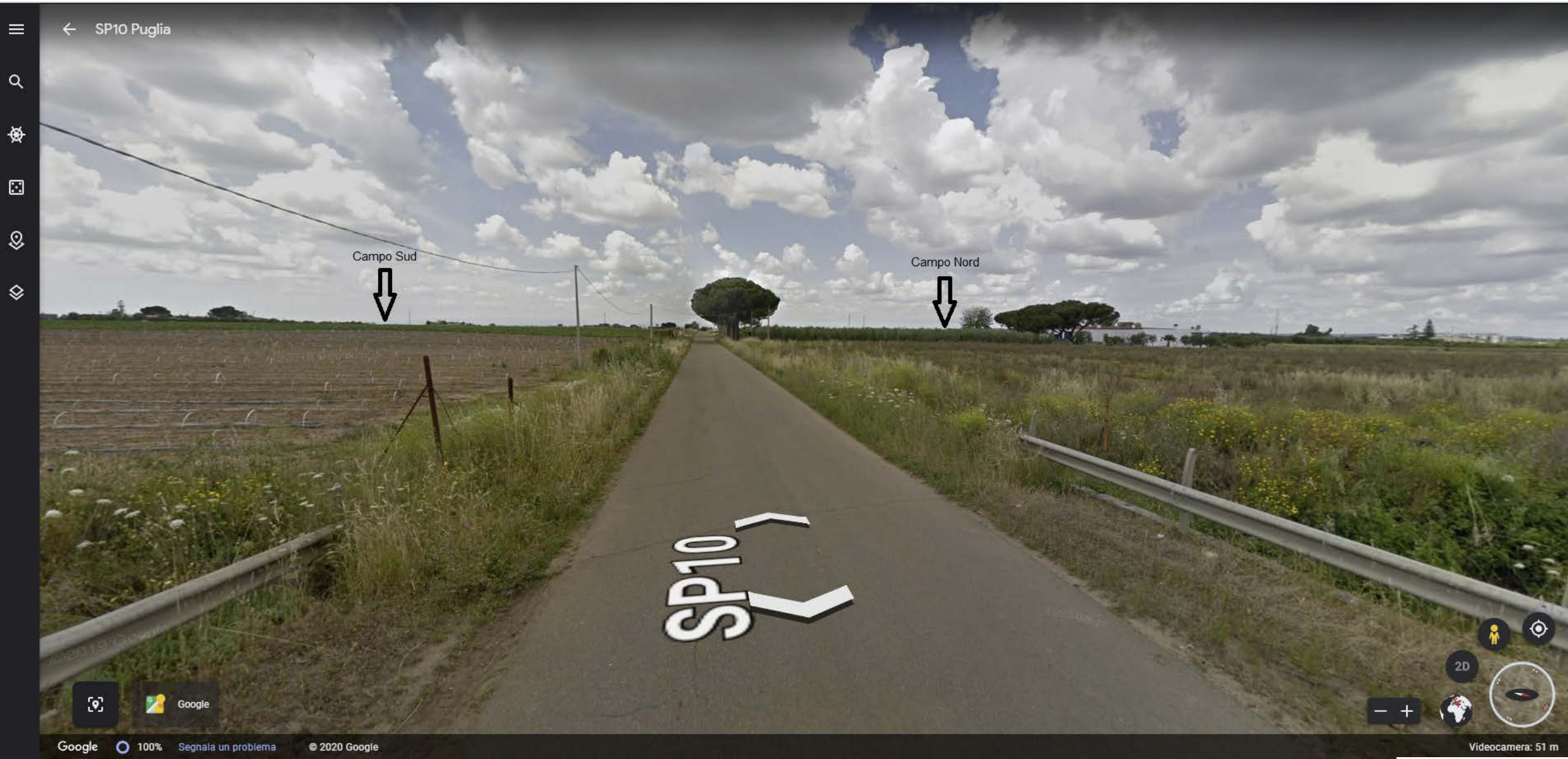
Inquadratura territoriale di progetto VISIBILITA' DELLE AREE DI PROGETTO - Punto di vista n.4 - STRADA PROVINCIALE N.10 - Da Est a 3 km di distanza - 46 mt s.l.m.