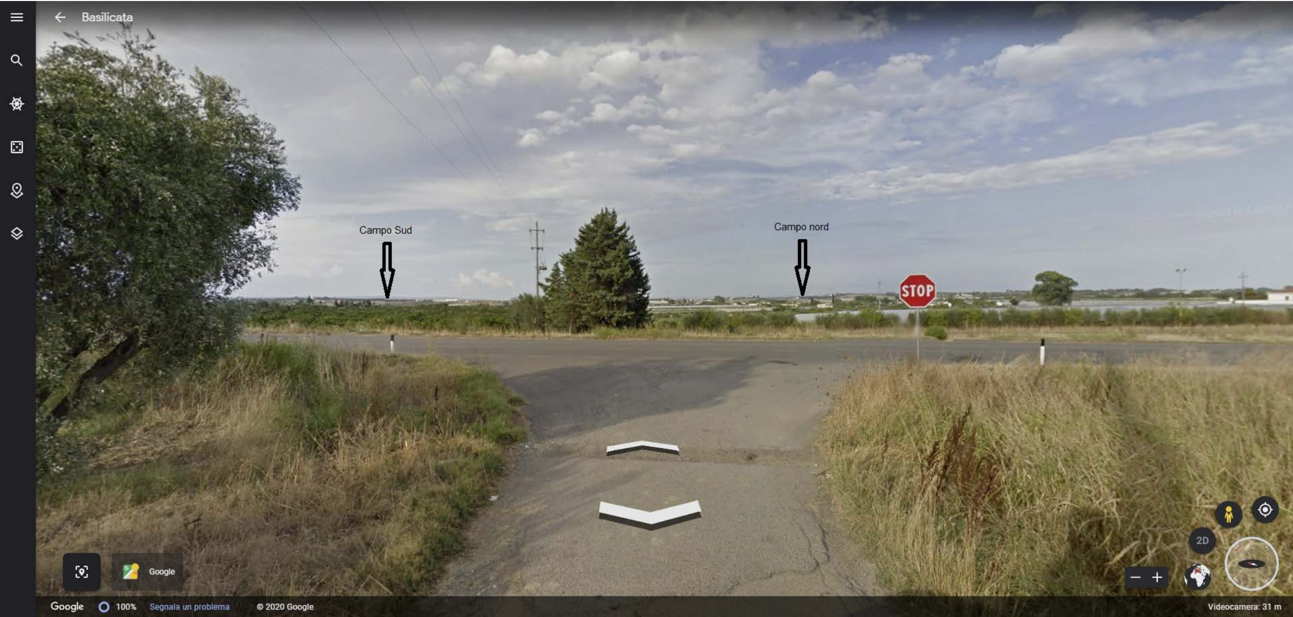
Inquadramento territoriale di progetto VISIBILITA' DELLE AREE DI PROGETTO - Punto di vista n.6 - STRADA PROVINCIALE n.3 - Da Ovest a 5 km di distanza - 34 mt s.l.m.