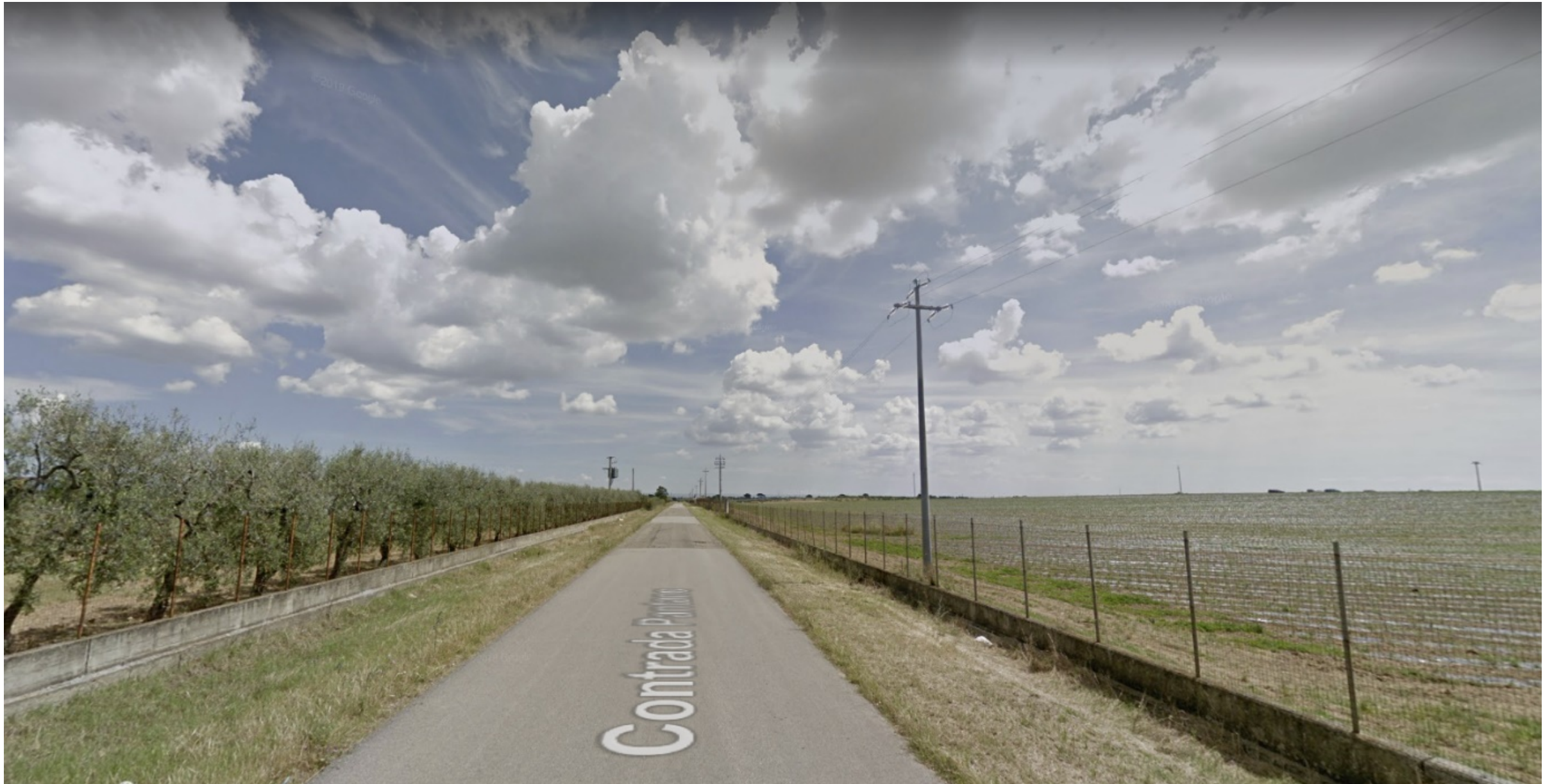
Inquadramento territoriale di progetto VISIBILITA' RAVVICINATA DEL PARCO - Ante e Post Operam - Campo Sud