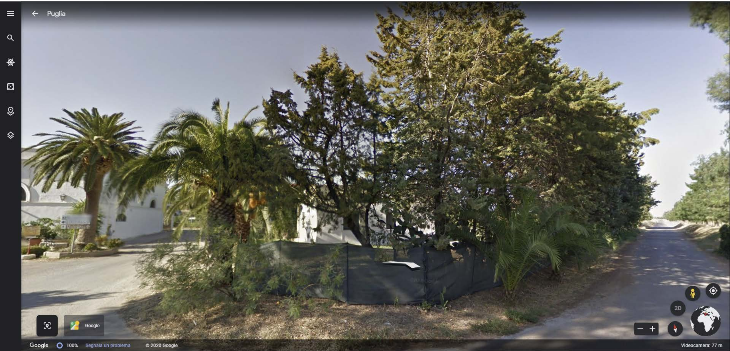
Inquadratura territoriale di progetto VISIBILITA' DEL PROGETTO DALLA MASSERIA GIRIFALCO