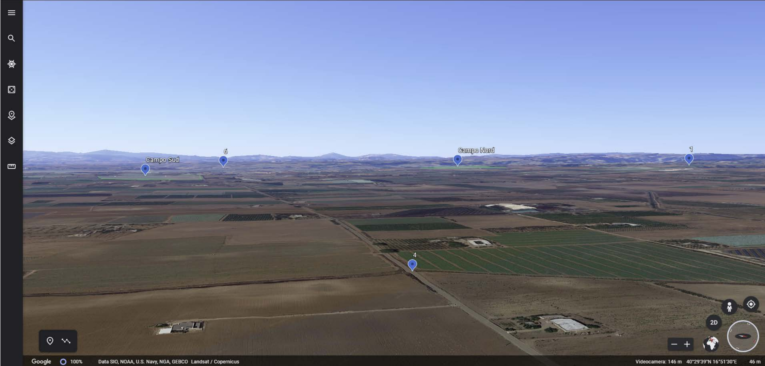
Inquadratura territoriale di progetto VISIBILITA' DELLE AREE DI PROGETTO - Punto di vista n.4 - STRADA PROVINCIALE N.10 - Da Est a 3 km di distanza - 46 mt s.l.m.