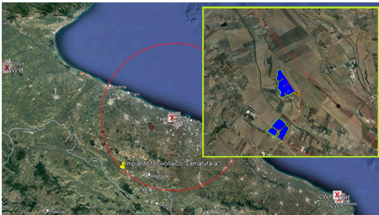
Figura 1 – Determinazione distanza delle opere in progetto rispetto all'aeroporto Aeroporto Internazionale di Bari-Karol Wojtyla (il cerchio in rosso indica il limite del settore 5 [45 km])

Che l'impianto in progetto non rientra nei settori 1, 2, 3, 4, 5 e 5bis e pertanto non sussistono le condizioni per le quali necessita istruttoria da parte degli Enti ENAC - ENAV