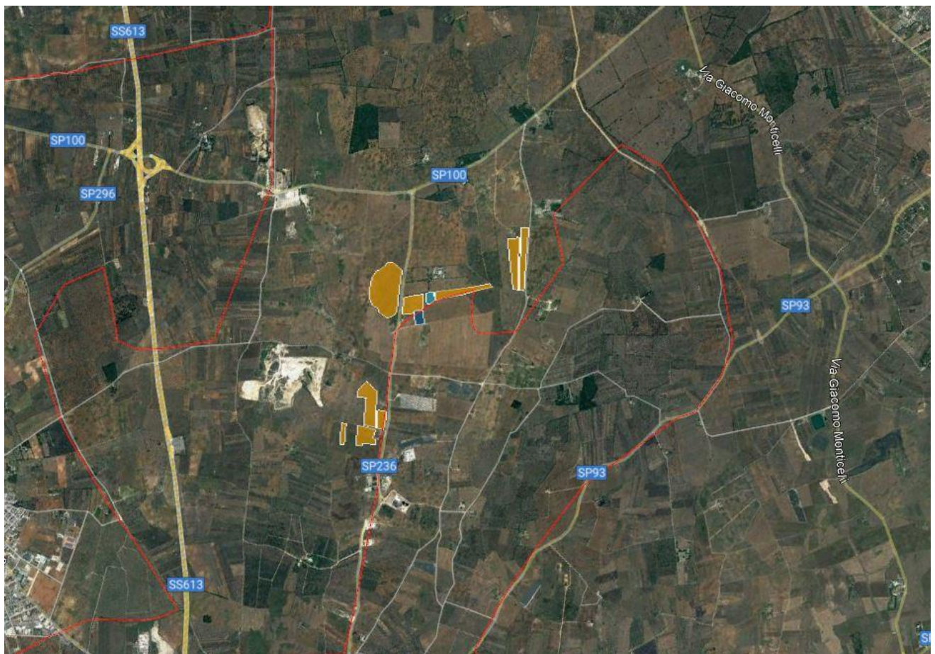
Figura 4-1: Inquadramento territoriale

Il sito interessato alla realizzazione dell'impianto e dalle relative opere di connessione in progetto si sviluppa tra il territorio del Comune di Lecce (LE) e il territorio del Comune di Surbo (LE) ed è raggiungibile dalla Strada Provinciale 236 che connette la SS613 con la SP100.