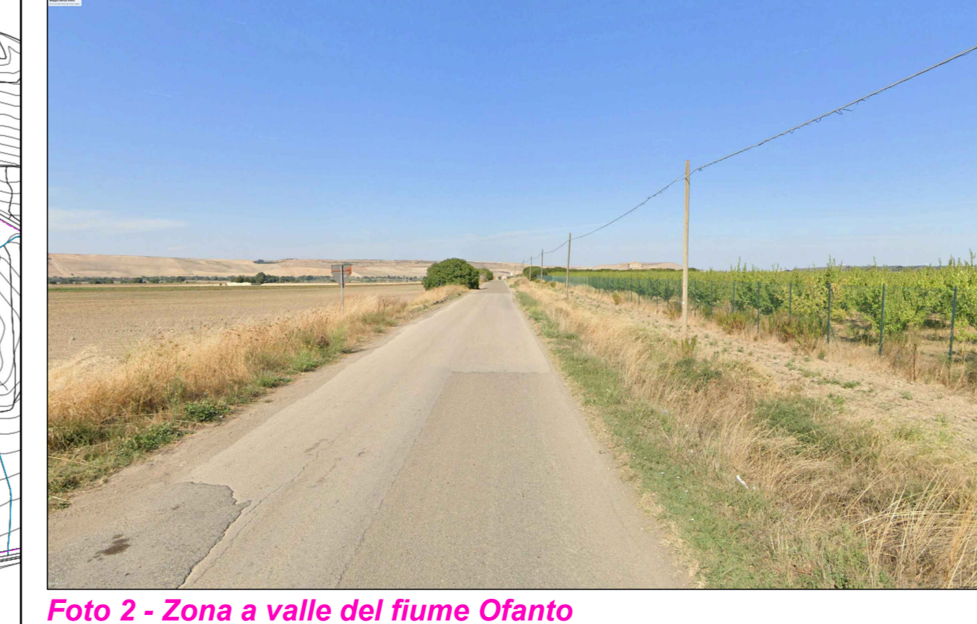
Foto 2 - Zona a valle del fiume Ofanto