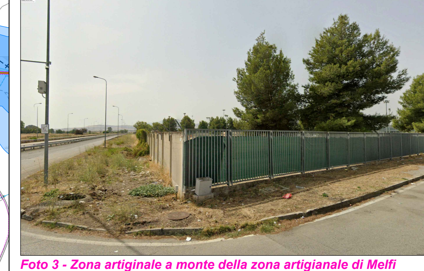
Foto 3 - Zona artigianale a monte della zona artigianale di Melfi