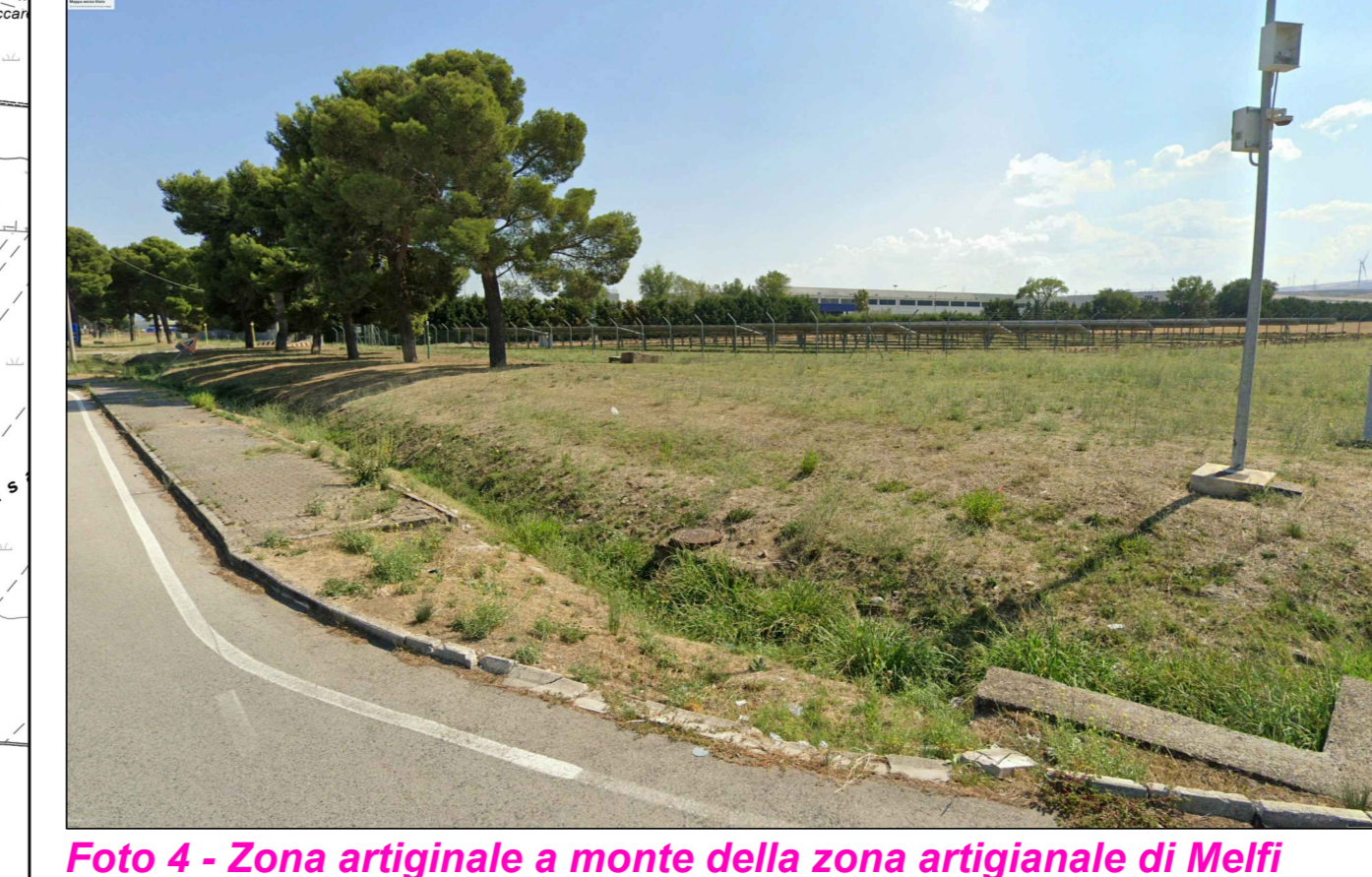
Foto 4 - Zona artigianale a monte della zona artigianale di Melfi