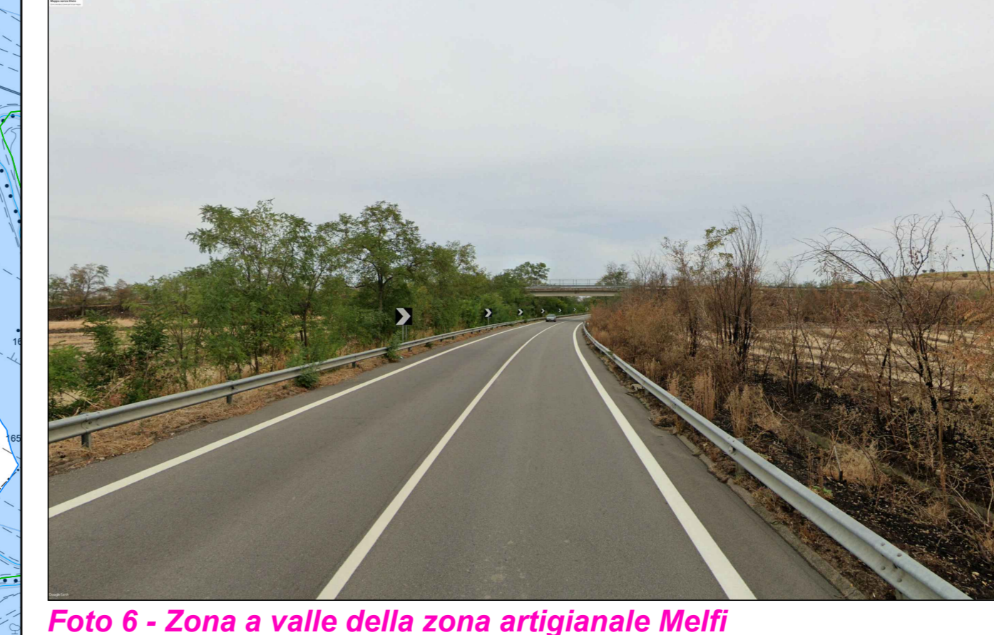
Foto 6 - Zona a valle della zona artigianale Melfi