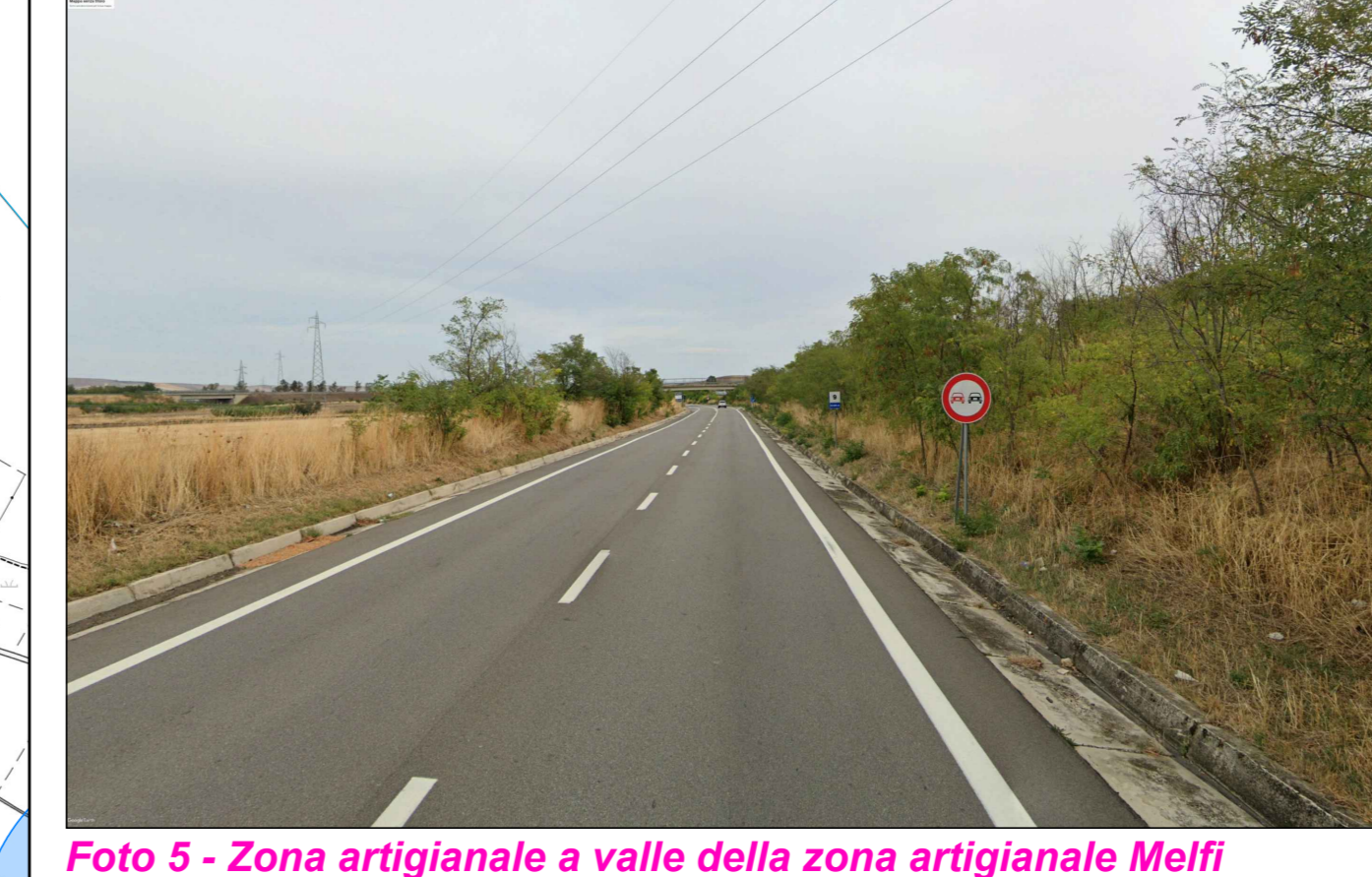
Foto 5 - Zona artigianale a valle della zona artigianale Melfi