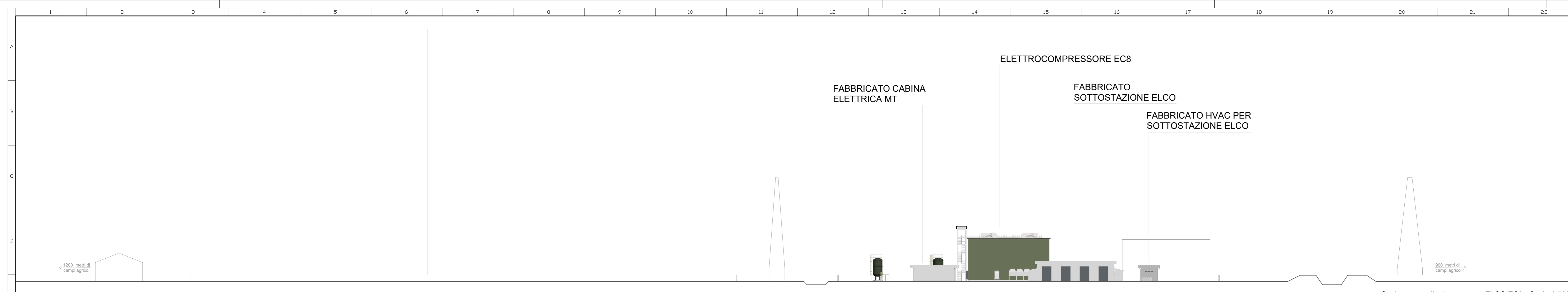
Sezione area di adeguamento ELCO EC8 - Scala 1:500