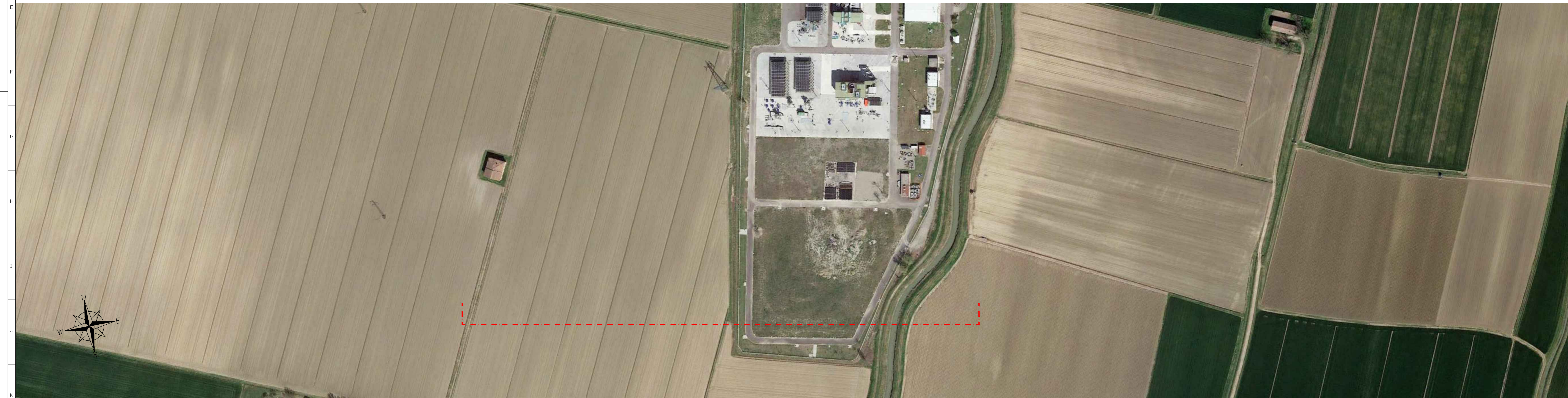
Planimetria contesto - Scala 1:1500