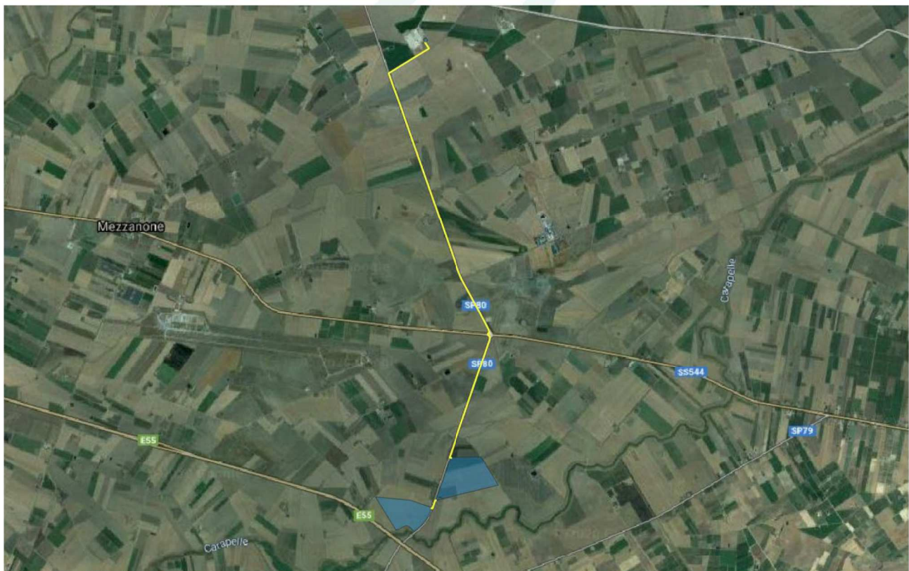
Figura 3-1: Localizzazione area di intervento, in blu la perimetrazione del sito, in giallo il tracciato della connessione

La zona in esame ricade nell'area del Tavoliere delle Puglie, nella zona a NW dell'area umida rappresentata dalle Saline di Margherita di Savoia, nel Comune di Cerignola a circa 10.5 km a nord dall'omonimo centro abitato e a 6.5 km a sud-ovest dal perimetro urbano di Zapponeta.