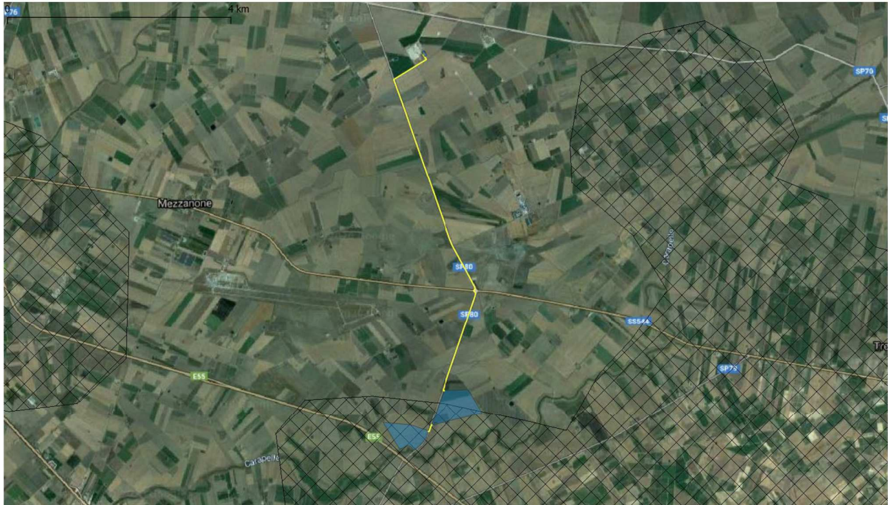
Figura 8-2: PTA - Aree Ulteriori, in blu la perimetrazione del sito, in giallo il tracciato della connessione