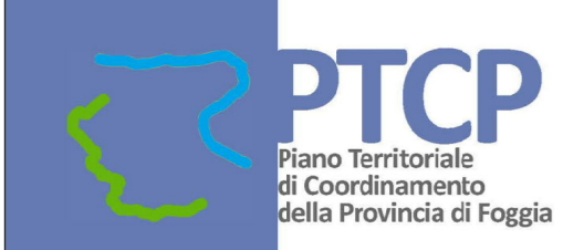
Tavola C Assetto territoriale 1:25 000