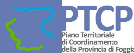
Tavola A1 Tutela dell'integrità fisica 1:25 000