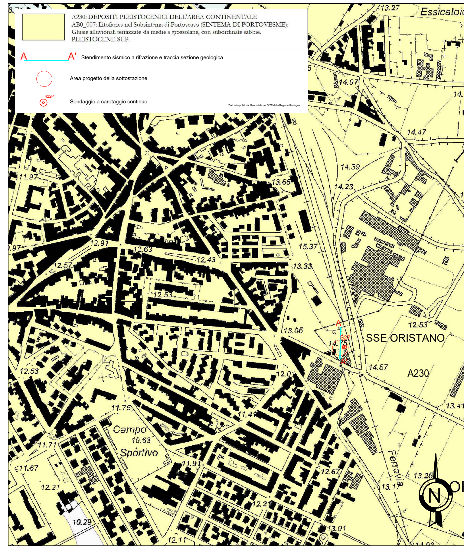
Carta Geologica - Scala 1:500