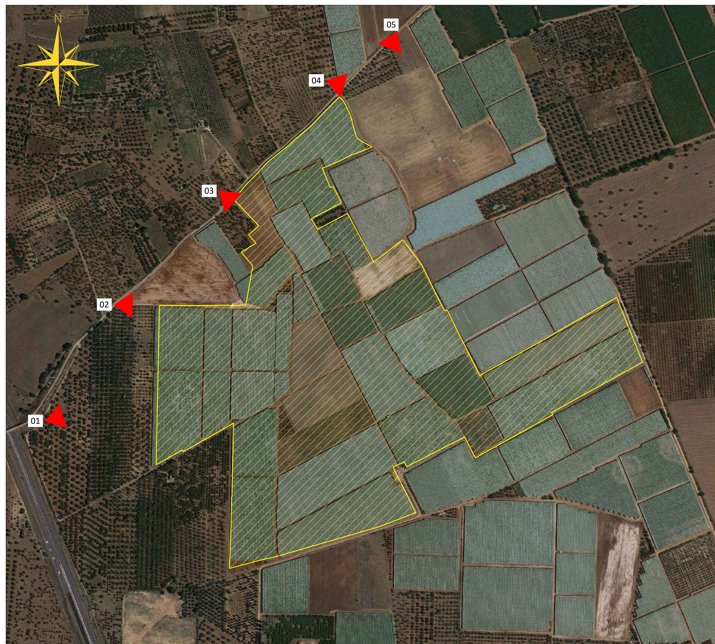
Identificazione dell'Area di Intervento su Ortofoto. Scala 1:4.000