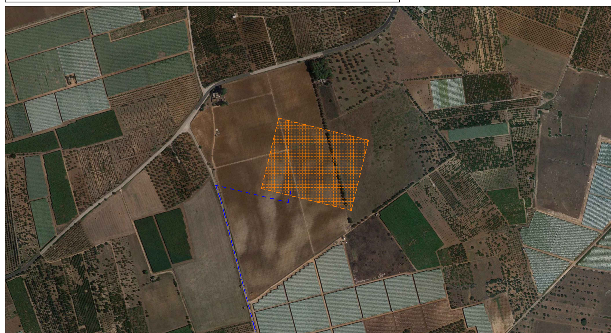
NUOVA S.E. TERNA SU STRALCIO DI ORTOFOTO - SCALA DI RIPRODUZIONE 1:4.000