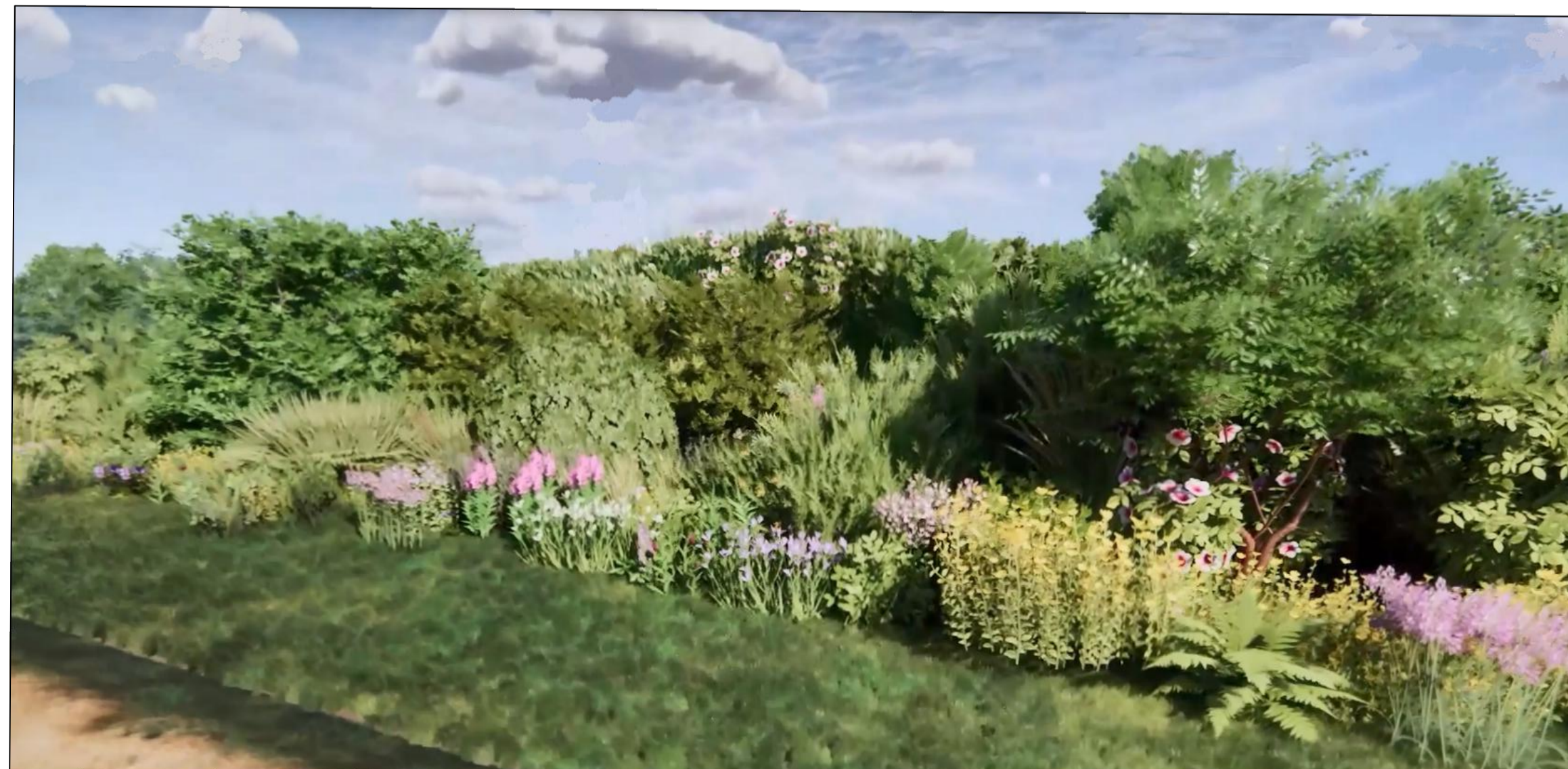
Composizione con essenze ad altezze diverse per mitigazione impatto visivo

COMUNI DI ALTAMURA (BA) E MATERA (MT) Province di Bari e Matera Regioni PUGLIA e BASILICATA