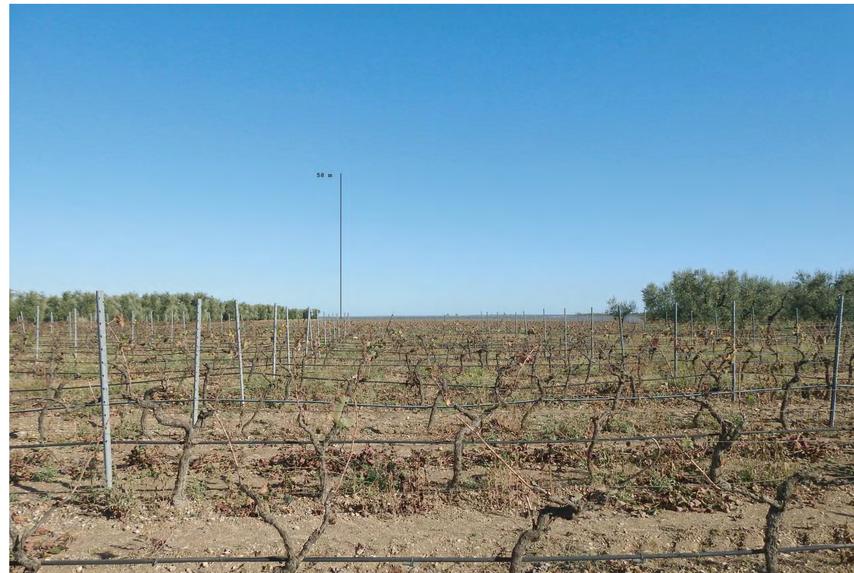
Campo Santa Maria dei Manzi Vista 9 stato di progetto