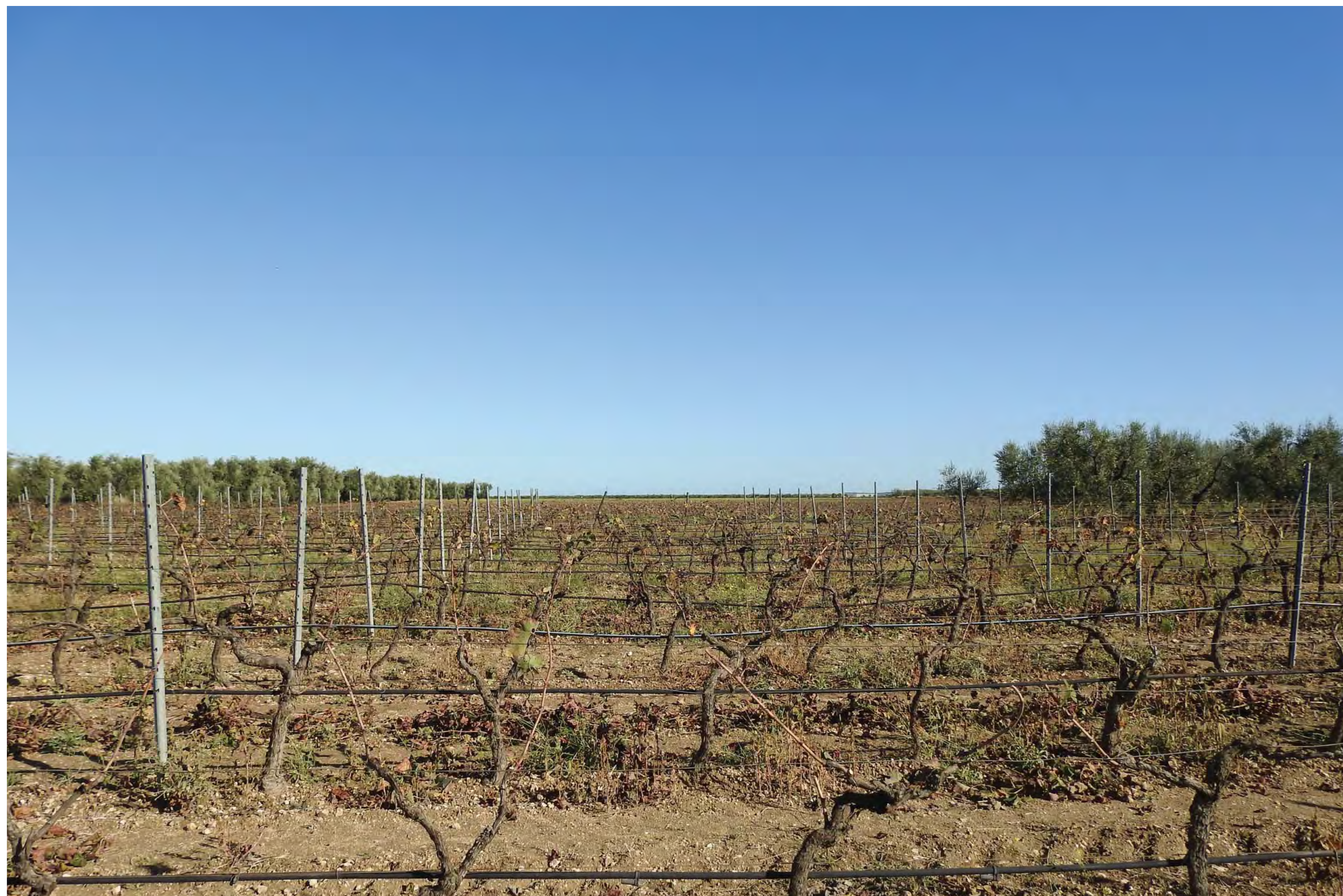
Campo Santa Maria dei Manzi Vista 9 stato di fatto