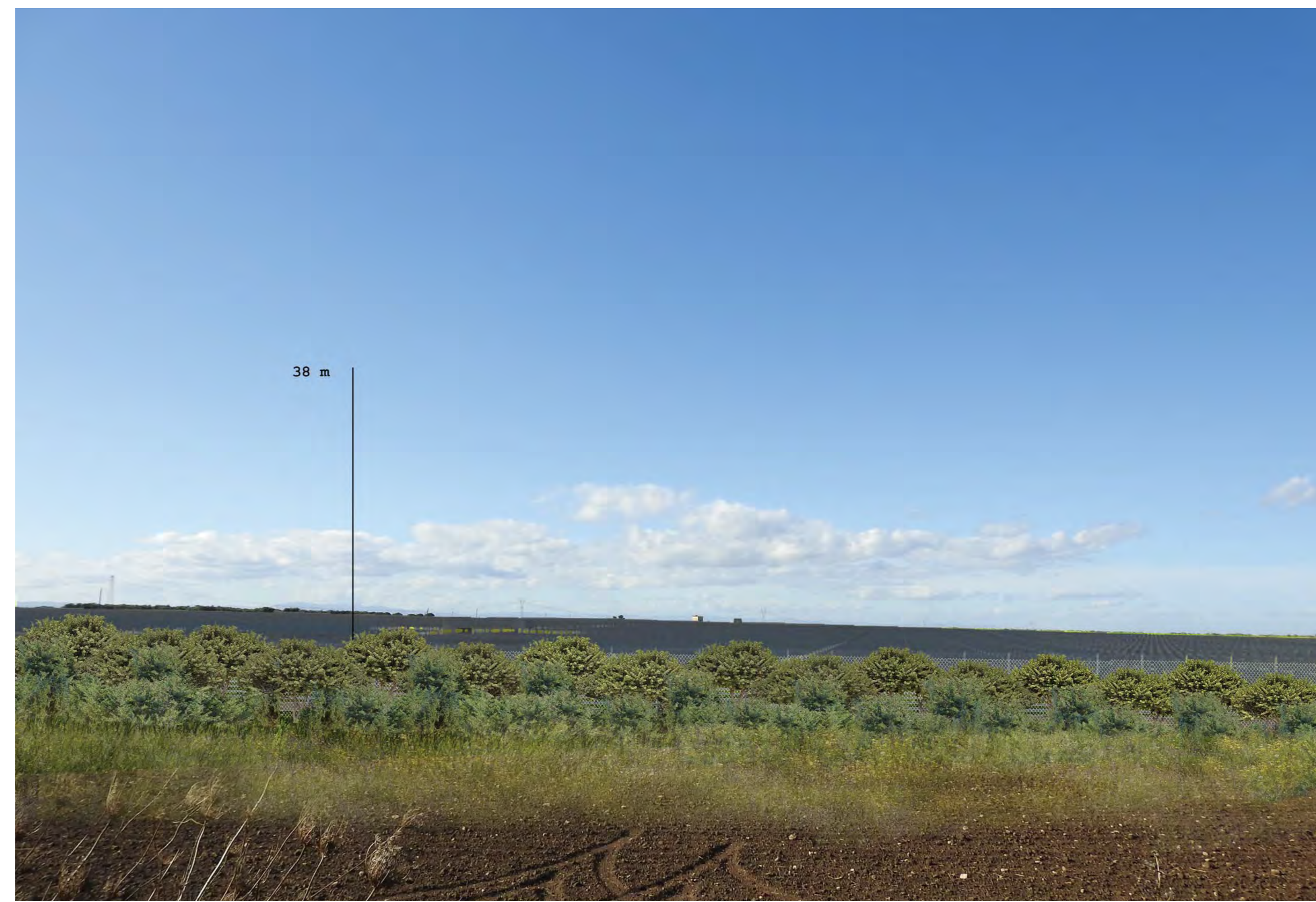
Campo Santa Maria dei Manzi Vista 7 stato di progetto