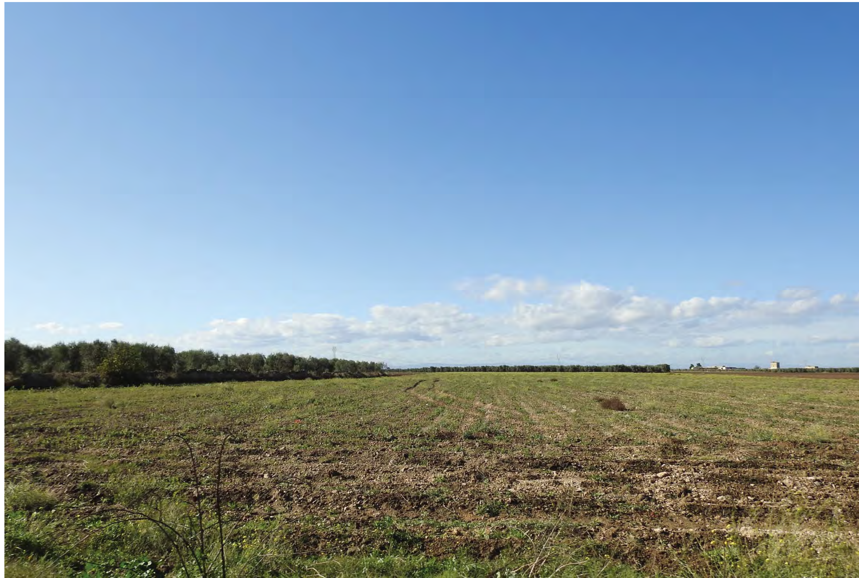
Campo Santa Maria dei Manzi Vista 8 stato di fatto