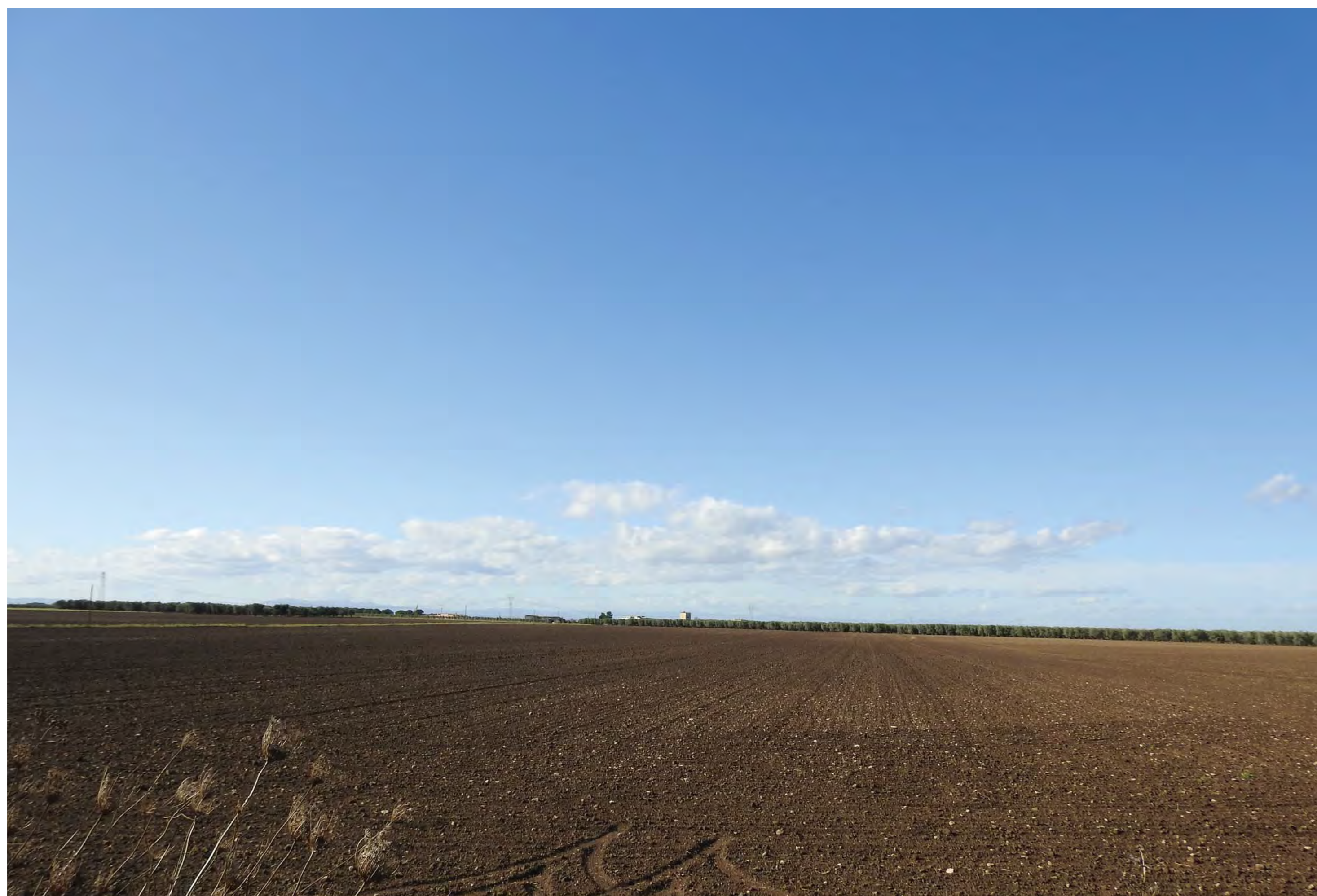
Campo Santa Maria dei Manzi Vista 7 stato di fatto