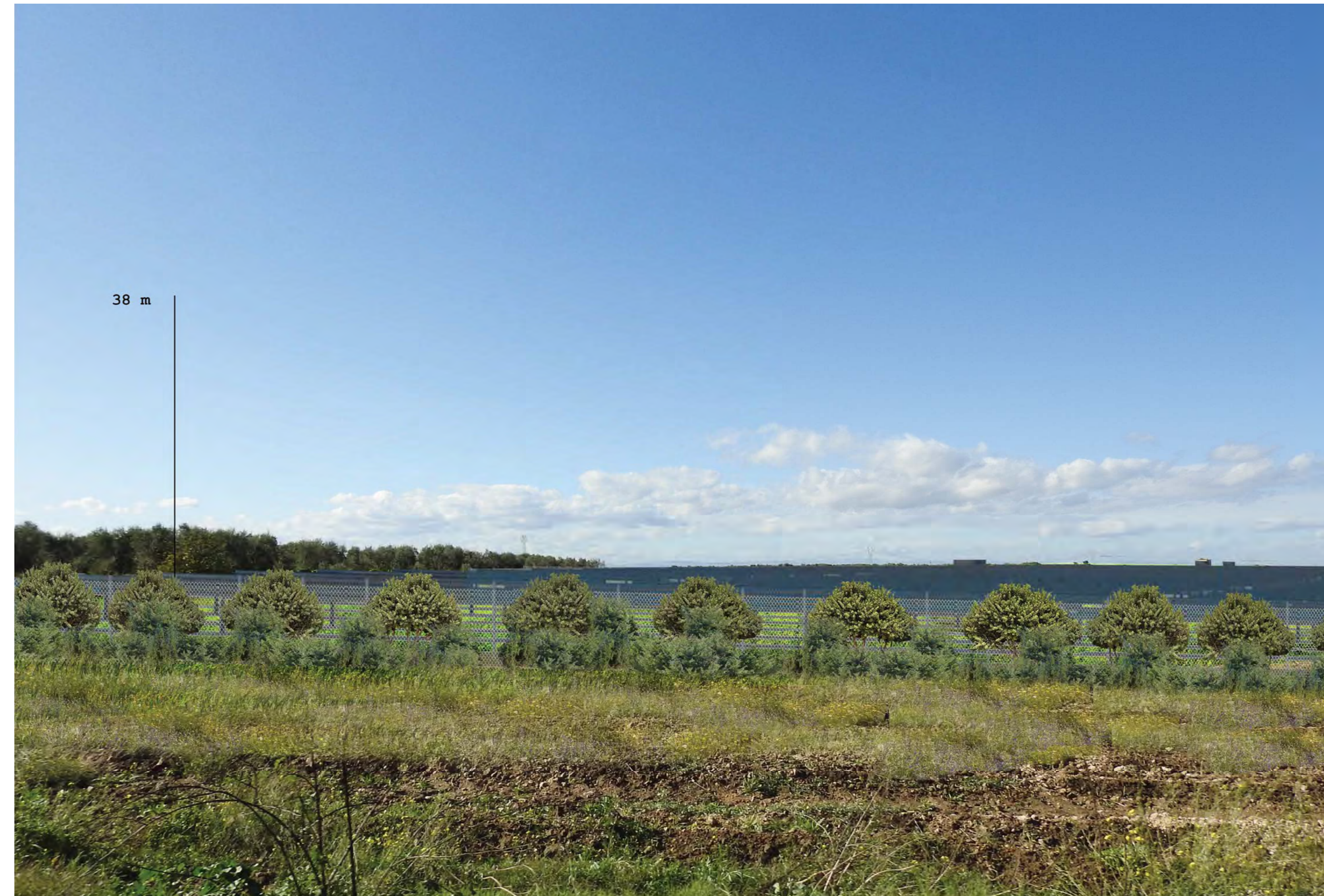
Campo Santa Maria dei Manzi Vista 8 stato di progetto