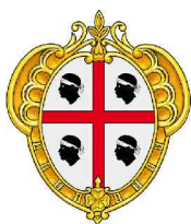
REGIONE AUTONOMA DELLA SARDEGNA