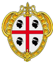
REGIONE AUTONOMA DELLA SARDEGNA