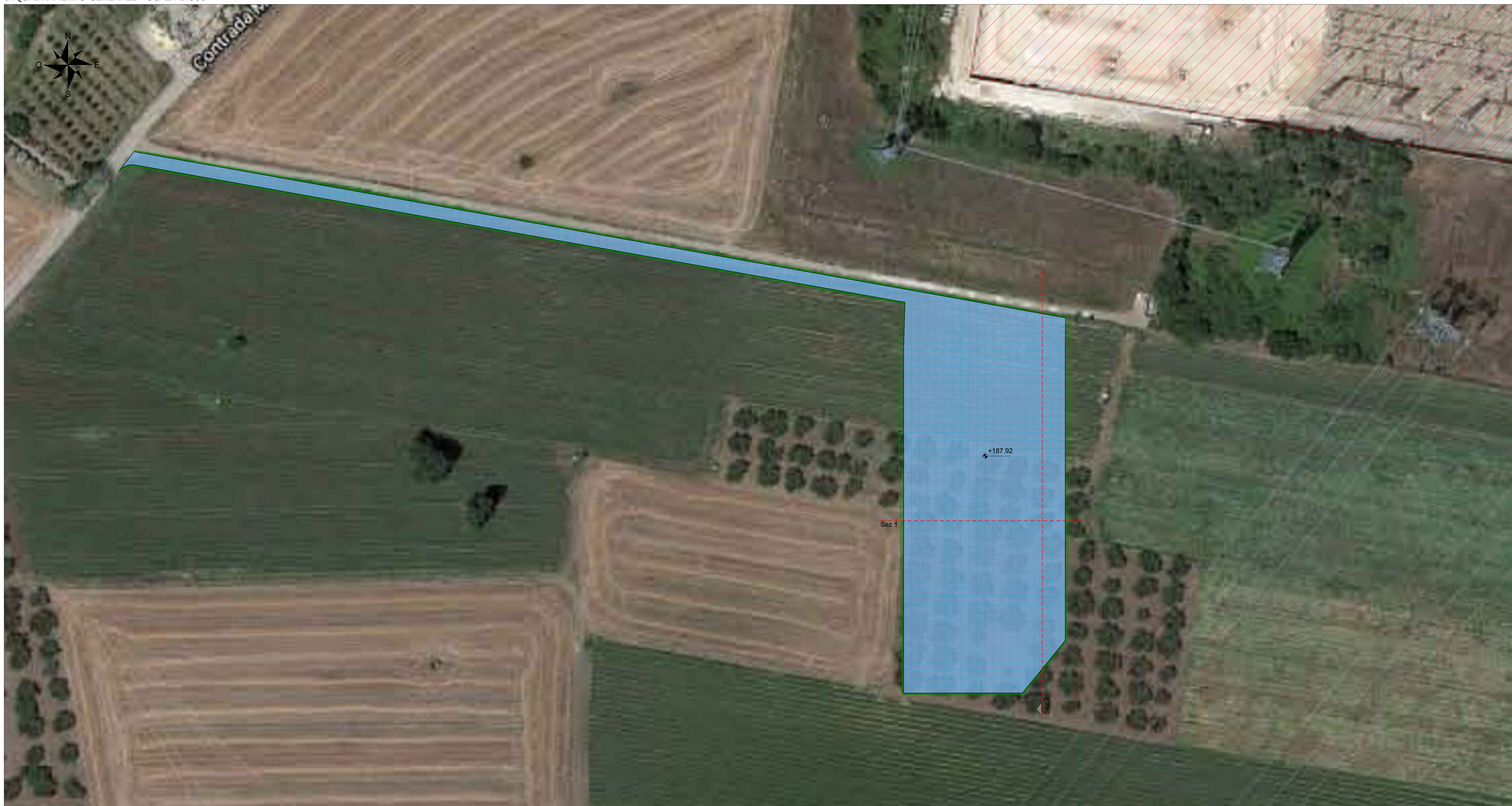
SEZIONI - SCALA 1:200