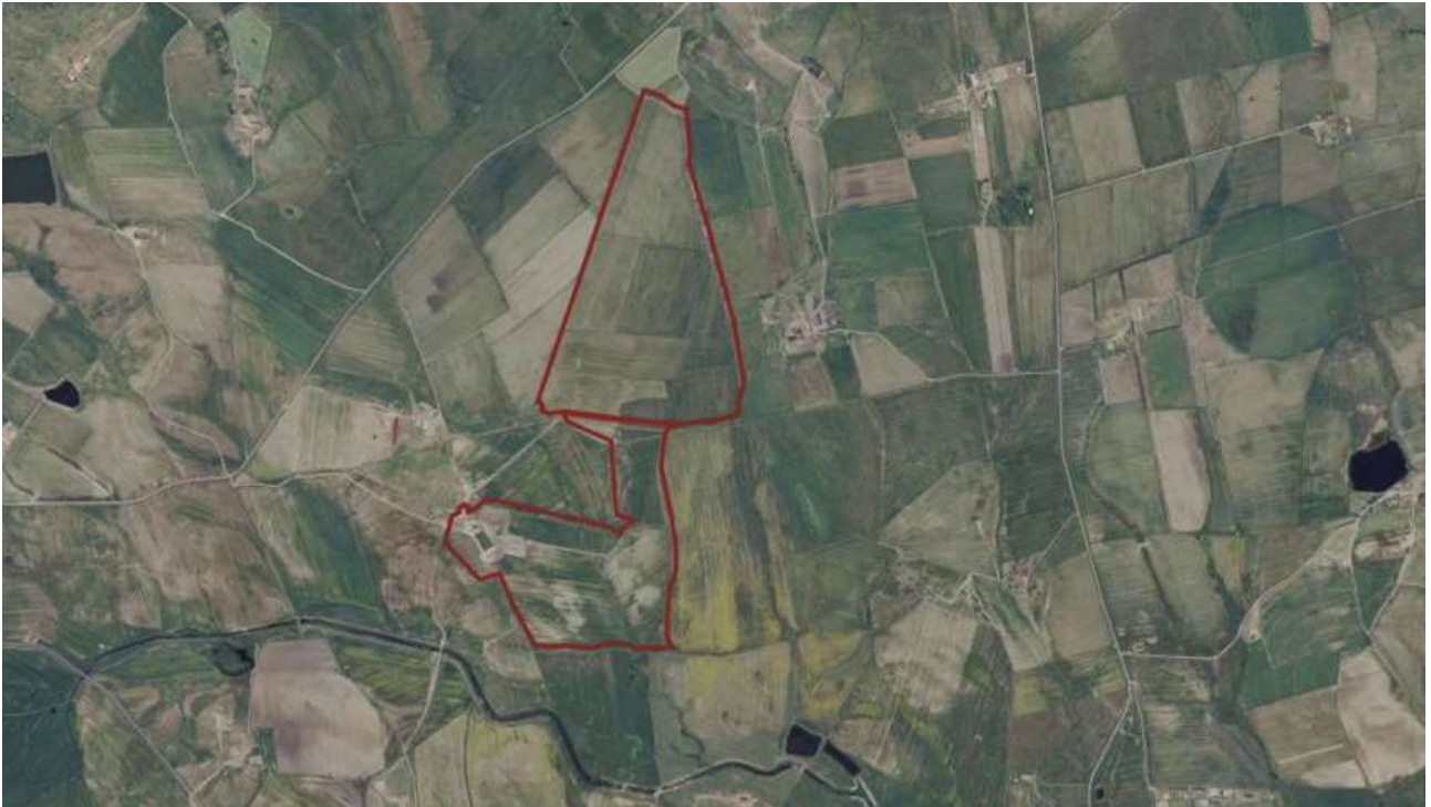
Fig. 1: Area di intervento.

Attualmente l'area è interessata da attività agricole, in prevalenza foraggio e da pascolo.