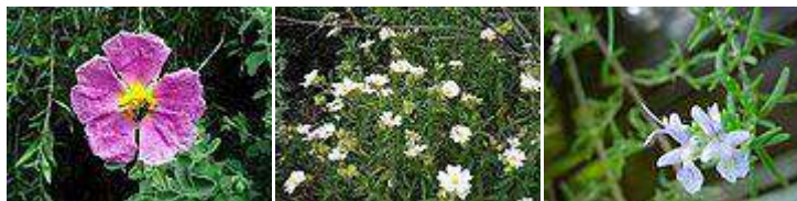
Lentisco – Cisto Villoso - Rosmarino

Come già anticipato nella presente relazione, con le limitazioni dettate dall'ombreggiamento dei