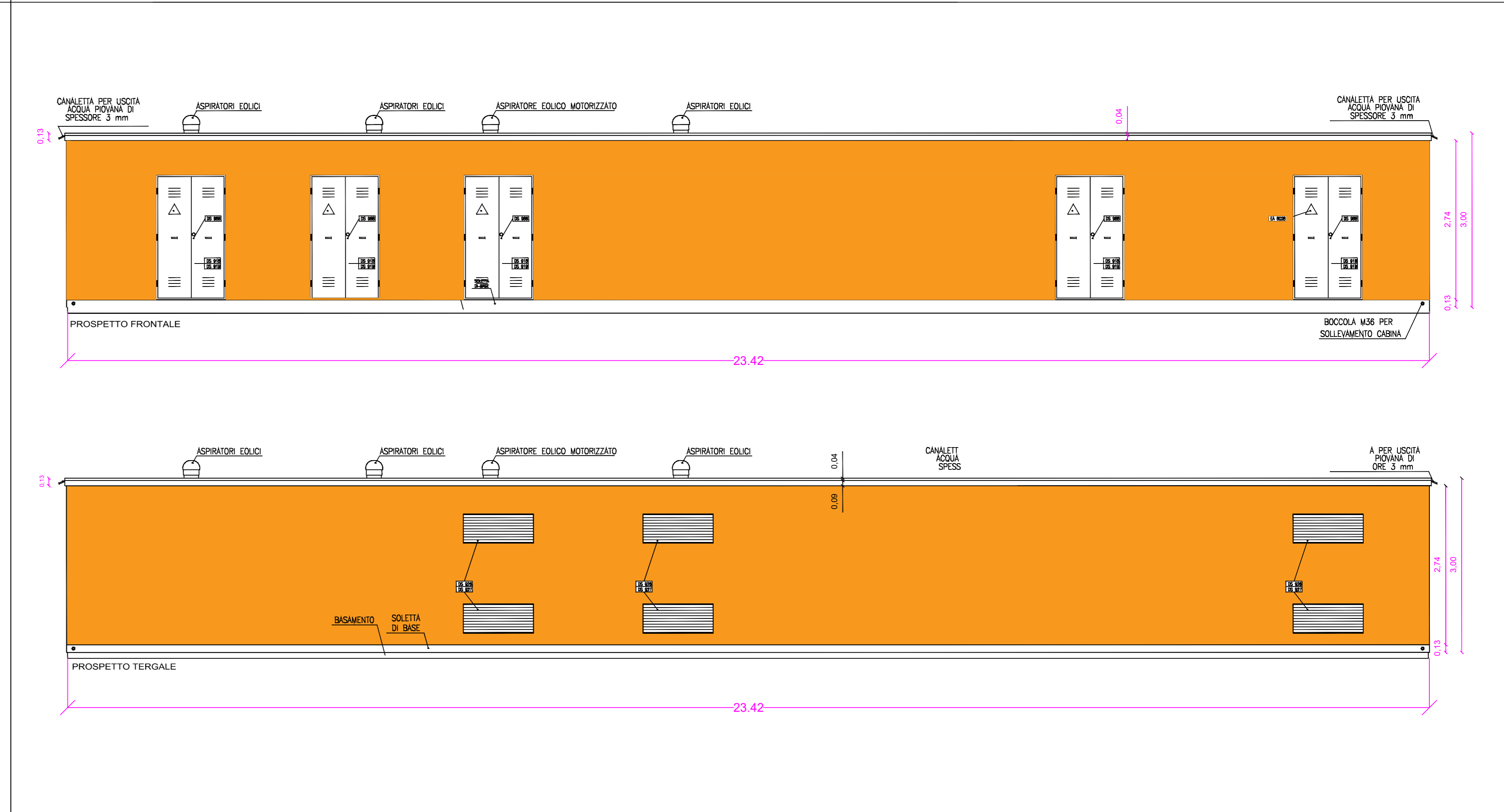
PROSPETTI FRONTALE E TERGALE CABINA DI INTERFACCIA