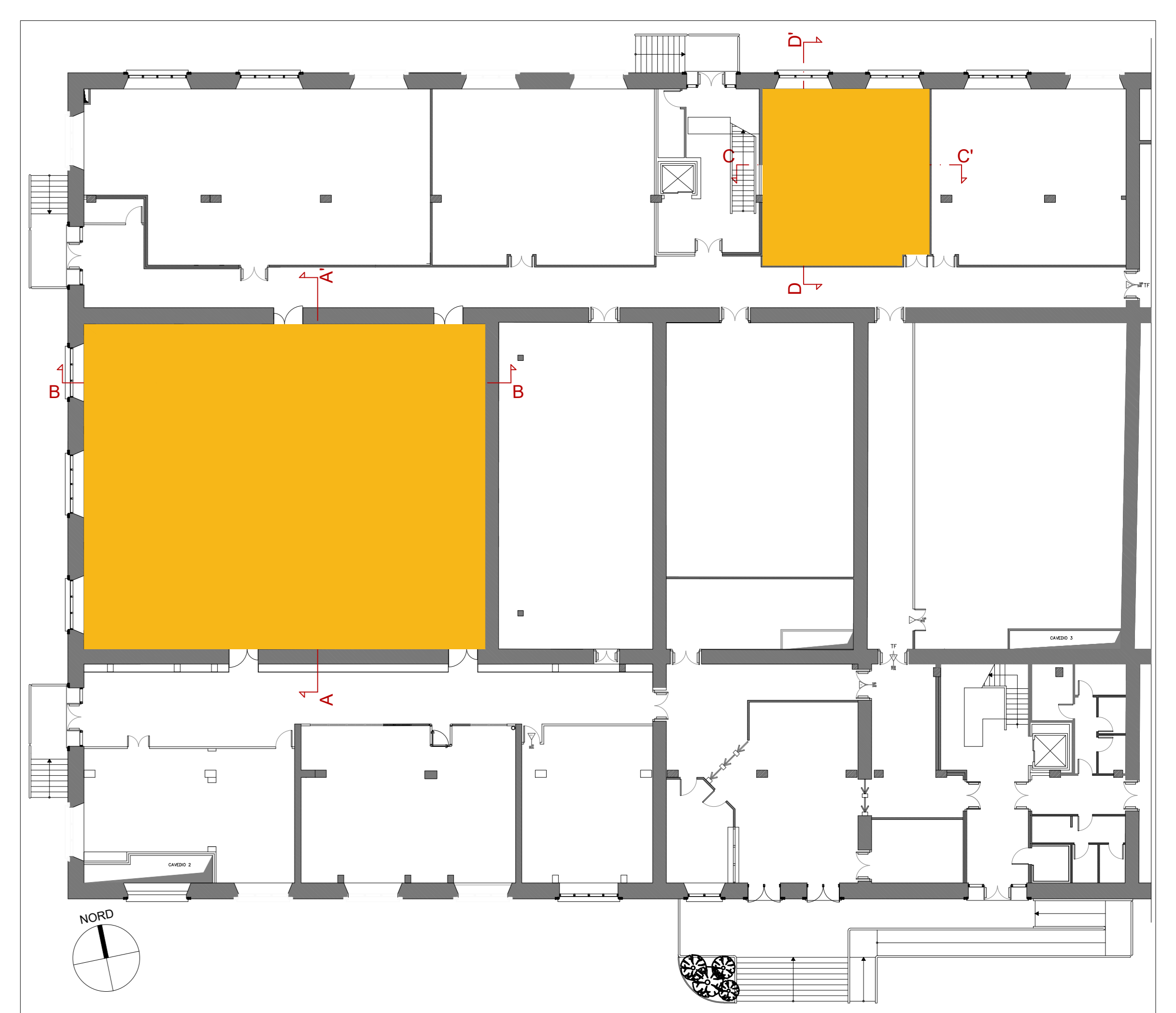
EDIFICIO PSC Scala 1:200 - - - - - area oggetto di intervento