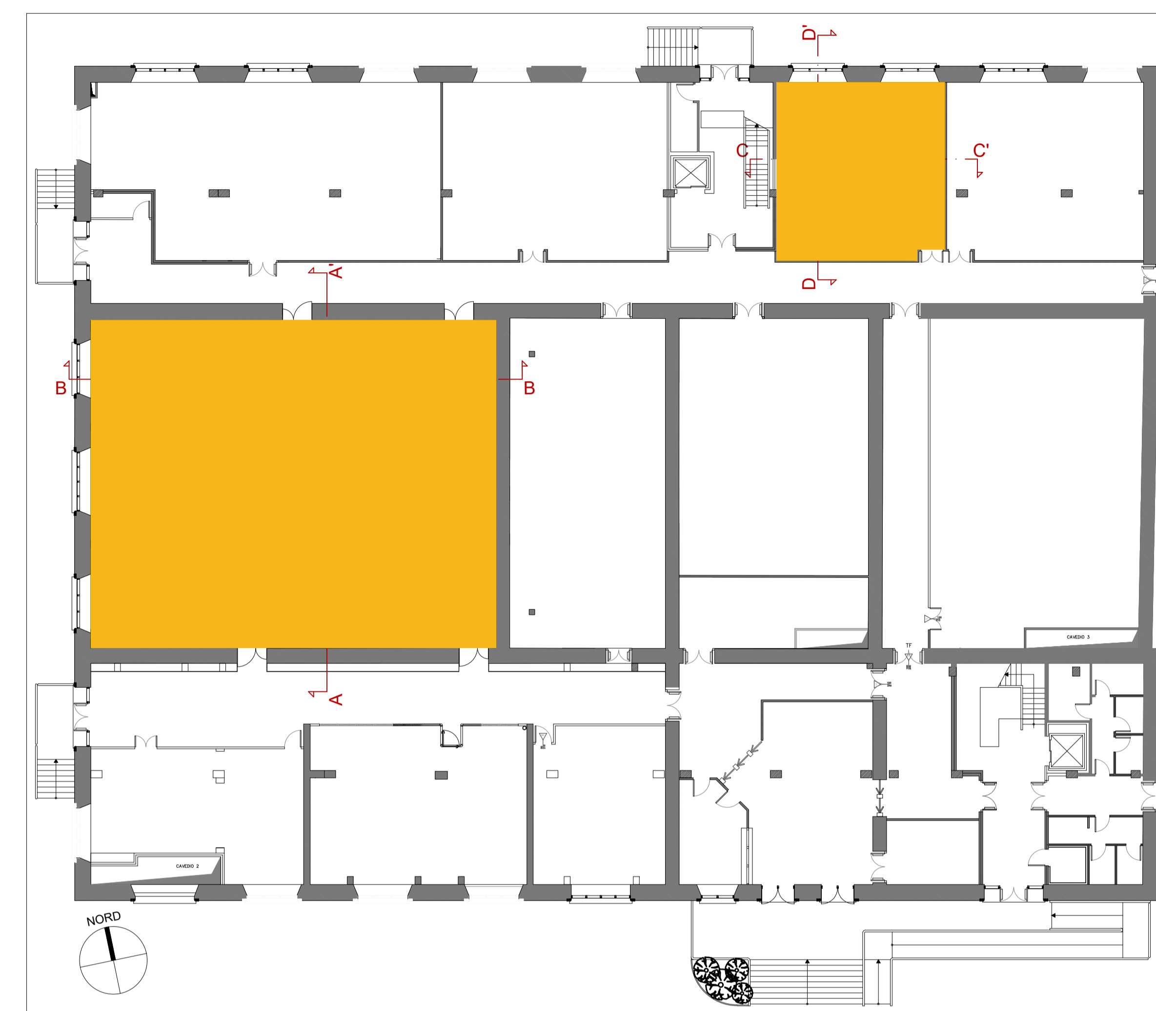
EDIFICIO PCS Scala 1:200 ■■■■■ area oggetto di intervento