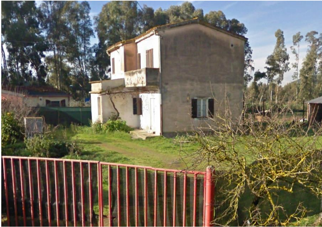
Figura 3: Ricettore R02

I fabbricati oggetto di verifiche sono costruiti con due piani fuori terra con copertura a falde, con struttura in muratura. Le fondazioni sono ipotizzate come cordoli in pietra a contorno del perimetro portante dell'edificio. Utilizzati come fabbricati per attività agricole e prevalentemente per ricovero di attrezzature agricole e deposito.