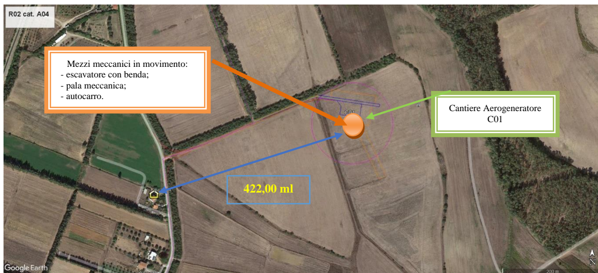
Figura 2: scenario 2 fondazioni WTG C01

Nelle immagini precedenti sono descritte le due condizioni al limite più sfavorevoli: