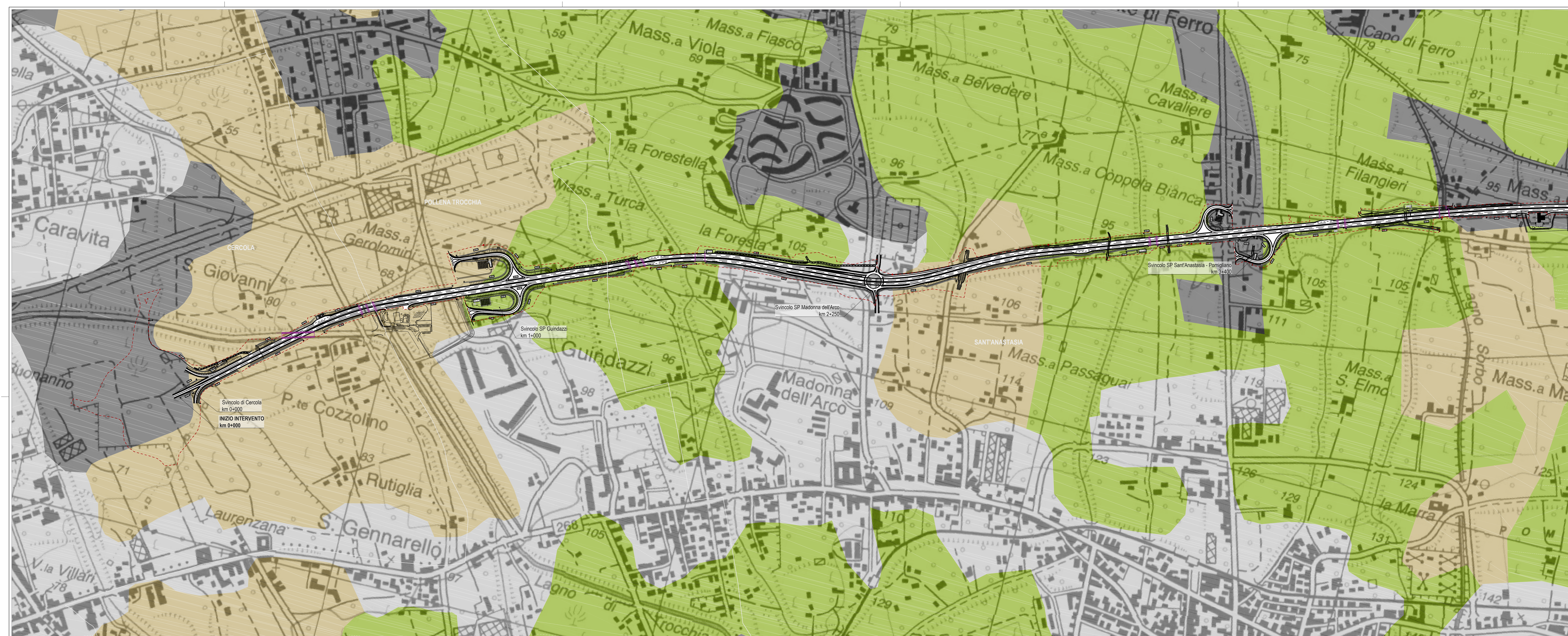
01 CARTA DELLA VEGETAZIONE REALE 1:5.000