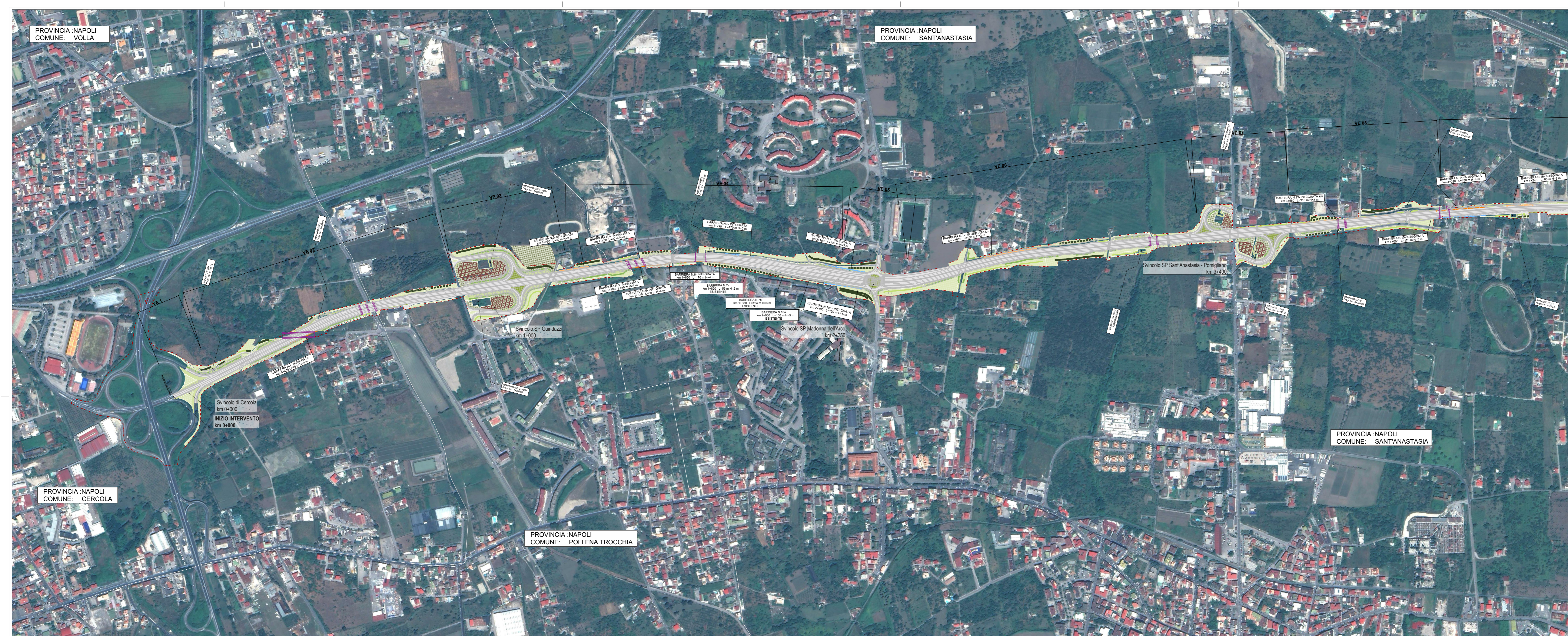
01 PLANIMETRIA GENERALE INTERVENTI DI INSERIMENTO PAESAGGISTICO AMBIENTALE 1:5.000