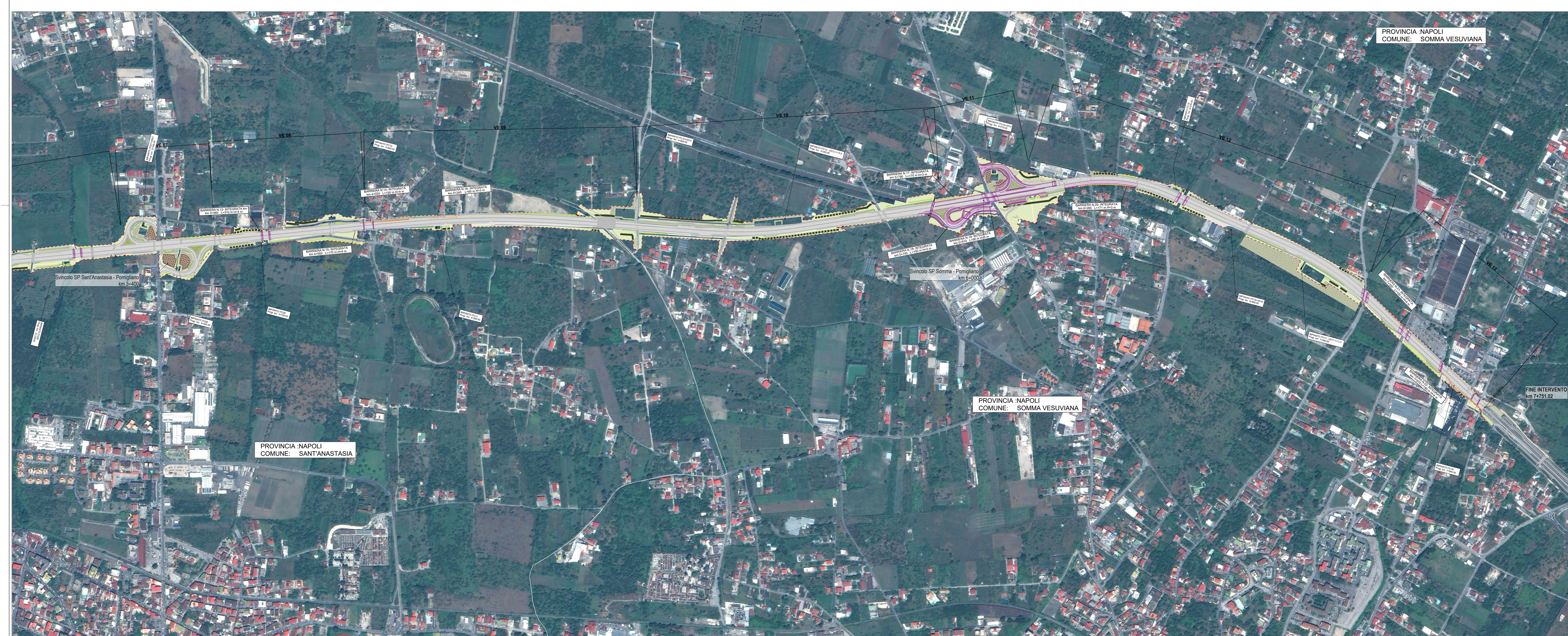
02 PLANIMETRIA GENERALE INTERVENTI DI INSERIMENTO PAESAGGISTICO AMBIENTALE 1:5.000