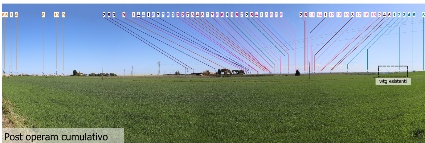
Post operam cumulativo