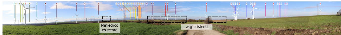
Post operam cumulativo