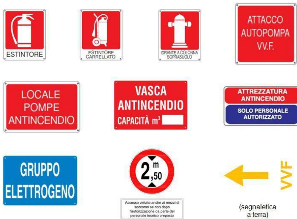
Figura 3: Esempi di segnaletica di sicurezza