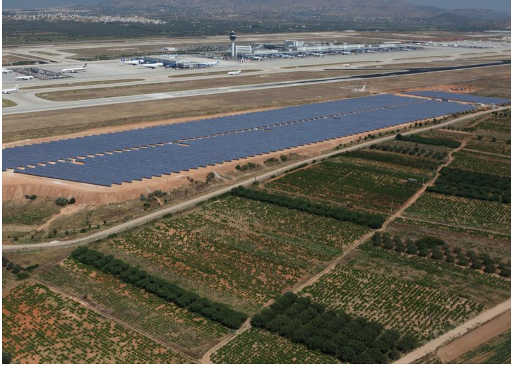
Fig. 5 : Aeroporto di Atene con impianto fotovoltaico