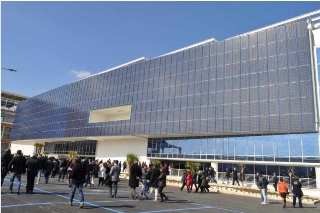
Aeroporto Karol Wojtyła di Bari