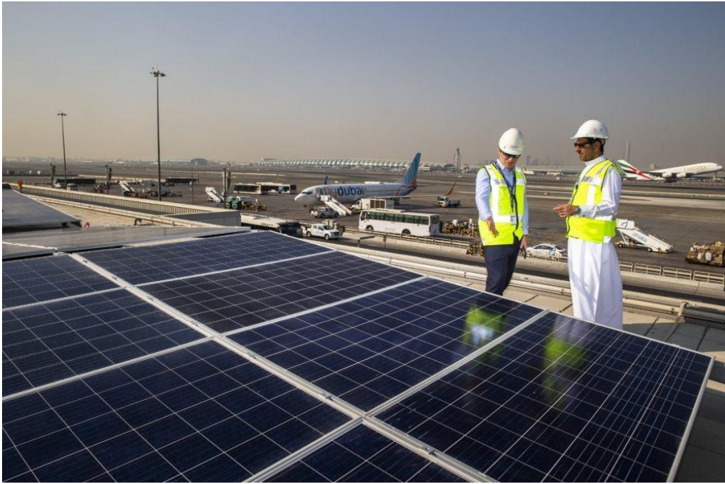
Fig. 7: Aeroporto di Dubai