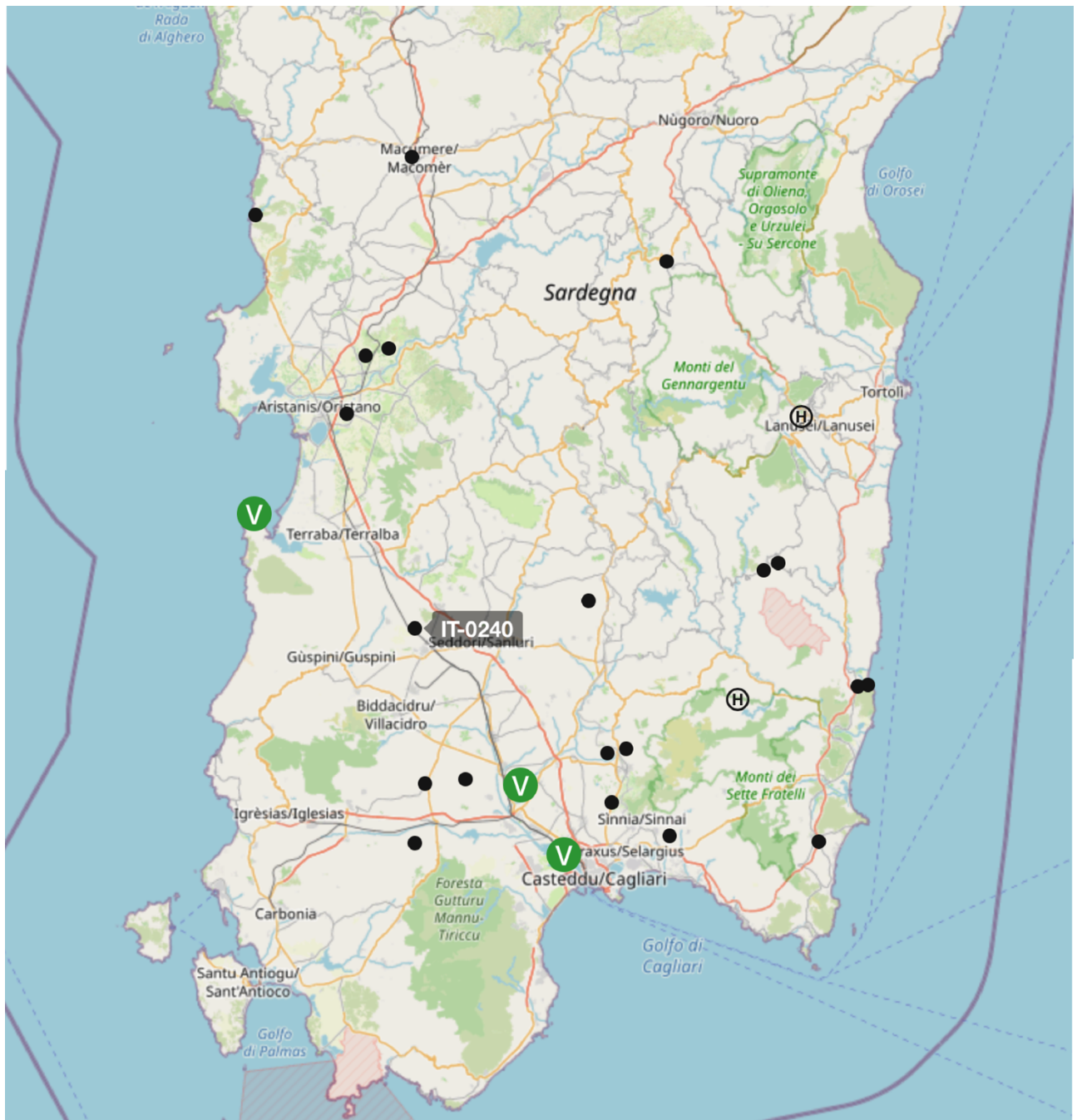
Fig 1: Aeroporti e campi di volo del Sud Sardegna