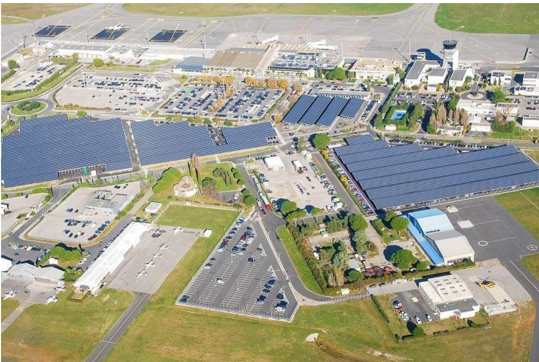
Fig. 8: Aeroporto di Montpellier