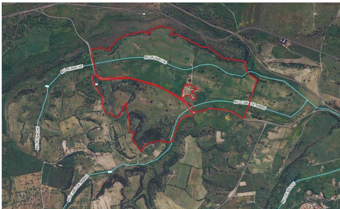
Fig. 1: inquadramento

Il progetto si configura come realizzazione di un'attività di industria energetica, l'area risulta inclusa nella cartografia catastale al foglio 110, particelle 140, 137, 57, 110, 10, 134, 70, 80, 79, 59, 41, 40, 131, 128, 73, 22, 23, 24, 25, 26, 166, 113, 71, 176, 170, 174, 172, 74, 168, 180, 178, 11 del comune di Gonnosfanadiga, terreni localizzati nella ZONA AGRICOLA E secondo quanto documenta il Certificato di Destinazione Urbanistica (CDU).