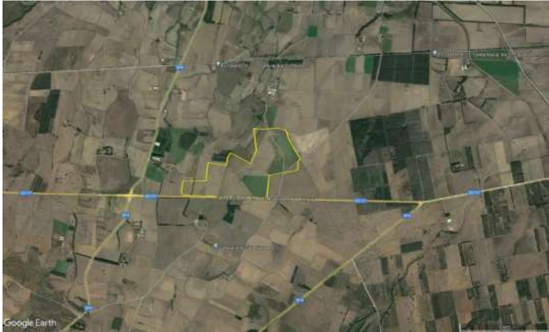
Fig.3 Viabilità stradale