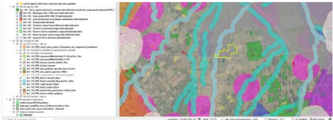
Fig. 2 Area di impianto - D.G.R. 59/90 del 2020

I siti particolarmente sensibili all'installazione degli impianti FTV sono: