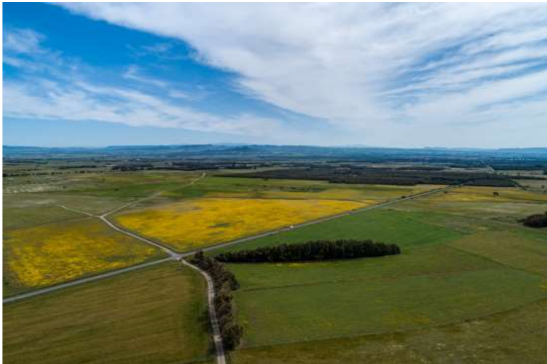
Fig.4 Vista area a volo d'uccello

In conclusione si evidenzia che, l'individuazione delle aree di progetto è stata definita anche tramite sopralluoghi diretti in campo che hanno permesso di evitare l'interessamento di aree non idonee da parte degli elementi impiantistici (moduli fotovoltaici, cabine elettriche, connessioni elettriche) e da parte delle opere di viabilità interna previsti dal progetto. L'analisi localizzativa condotta sui punti precedentemente evidenziati e sugli aspetti di carattere tecnico (esposizione del sito, ombreggiamento, presenza di infrastrutture ecc.) ha portato a ritenere il sito prescelto, idoneo ad ospitare l'impianto.