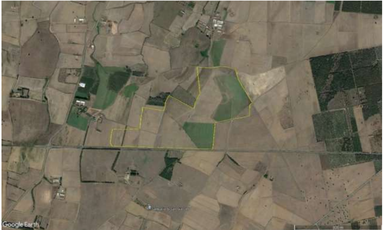
Fig. 1 Area netta di impianto

Il Quadro di riferimento delle alternative progettuali si pone lo scopo di presentare e valutare le motivazioni che hanno portato alla scelta di localizzazione dell'area, del layout e della tecnologia dell'impianto fotovoltaico di Gonnos-Mar. Le alternative tra cui la "zero", cioè quella di non realizzazione del progetto, in questo processo rappresentano un'opzione da valutare e di cui tener conto.