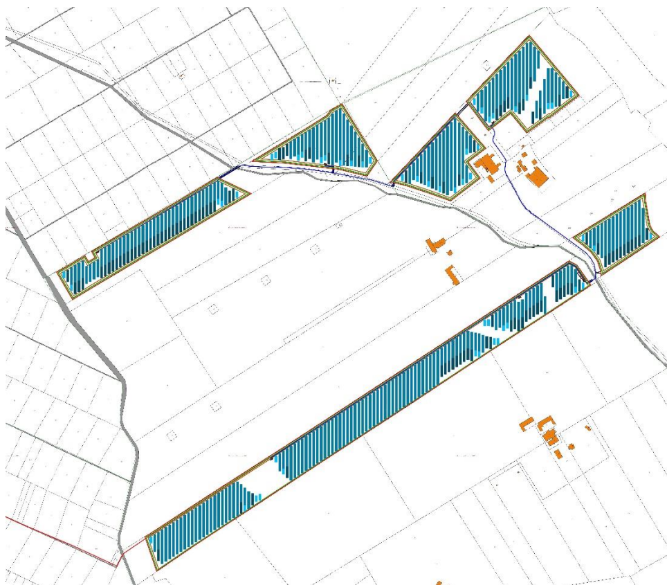
FIGURA 1 – Layout impianto con viabilità interna su Catastale.