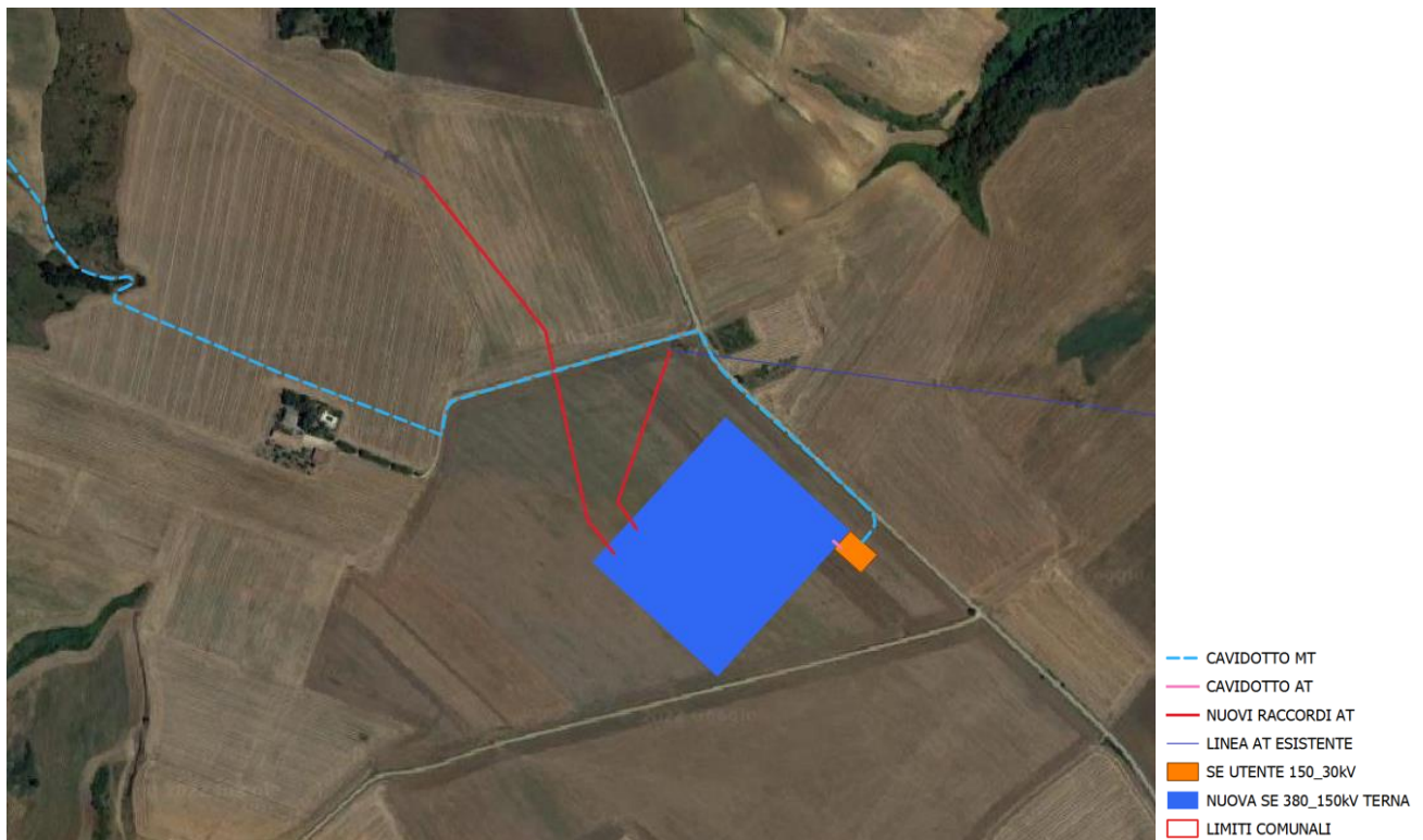
Figura 4-3: Inquadramento delle opere di connessione su ortofoto

Progetto per la realizzazione di un impianto agrovoltaiico e relative opere di connessione alla RTN da realizzare nel comune di Gravina in Puglia (BA).