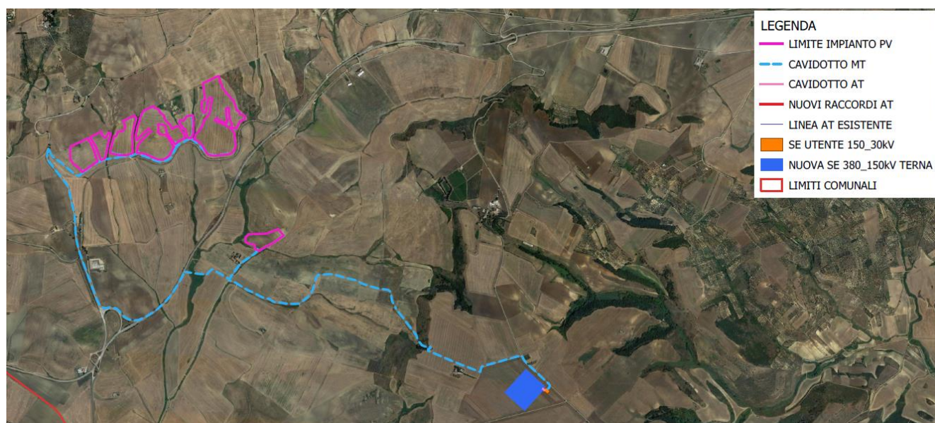
Figura 4-2: Inquadramento delle opere in progetto su ortofoto

Progetto per la realizzazione di un impianto agrovoltaico e relative opere di connessione alla RTN da realizzare nel comune di Gravina in Puglia (BA).