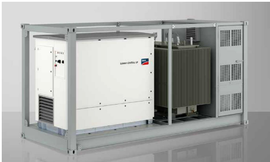
Figura 2: Esempio di soluzione integrata inverter e trasformatore in container da 20 piedi

Nel presente progetto è prevista la divisione dell'impianto in 5 sottocampi, che saranno gestiti da 4 inverter da 3060 kVA e 1 inverter da 4000 kVA. Ogni inverter sarà contenuto all'interno di un container prefabbricato destinato ad ospitare anche il trasformatore BT/MT.