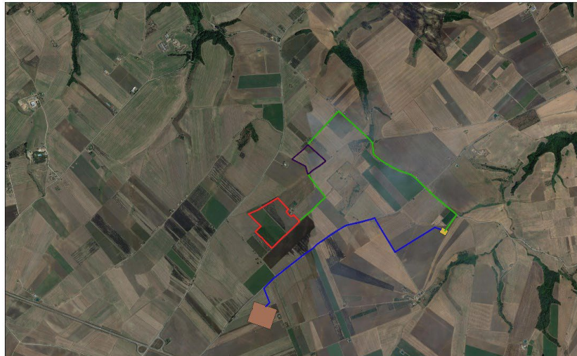
Figura 1 – Ortofoto con indicazione dell'area impianto e del tracciato di connessione.