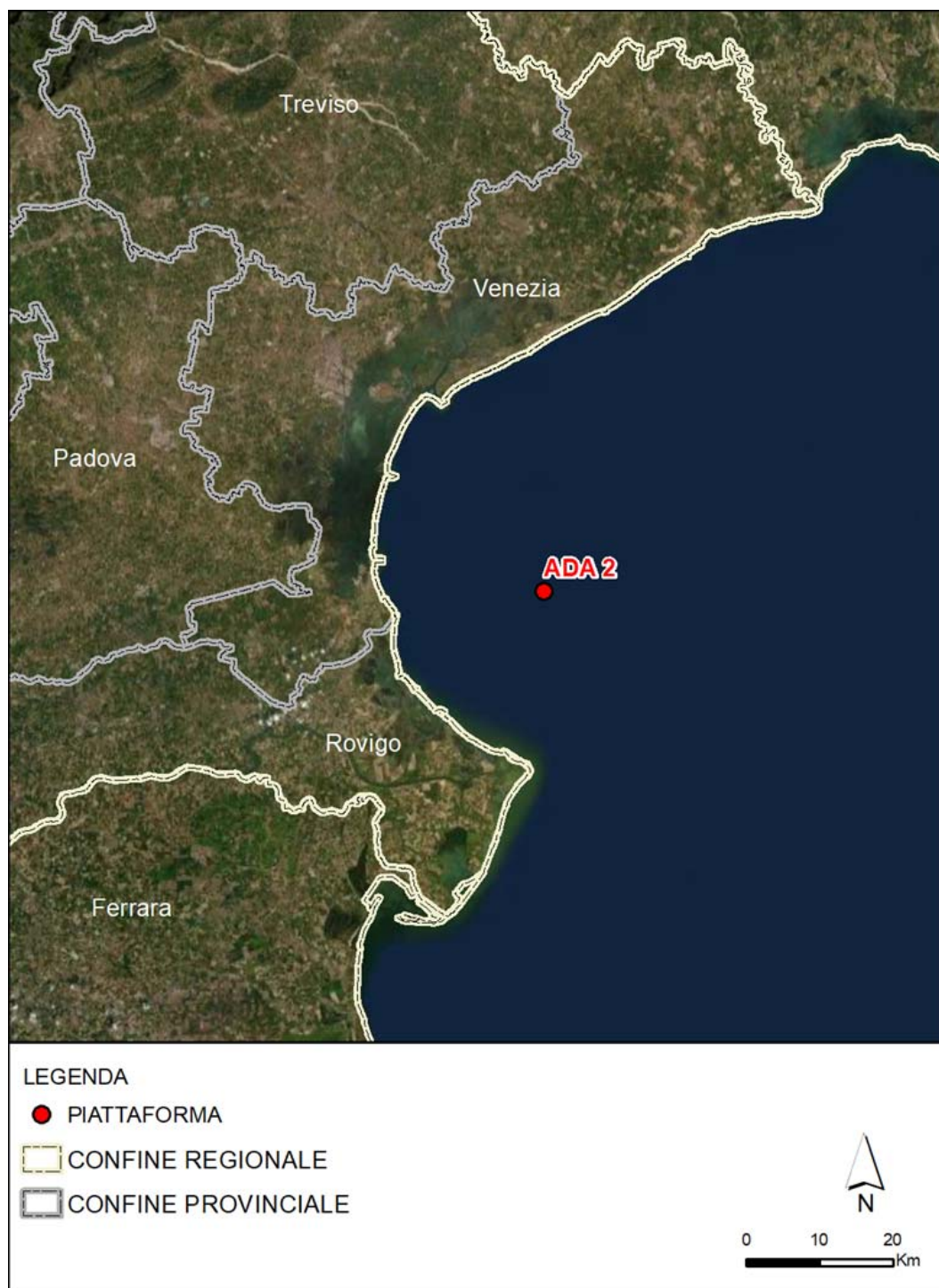
Figura 1 Ubicazione Piattaforma Ada 2

La piattaforma è costituita da una struttura monotubolare.