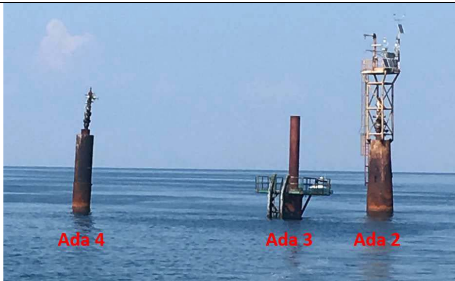
Figura 2 Vista complessiva del campo di Ada