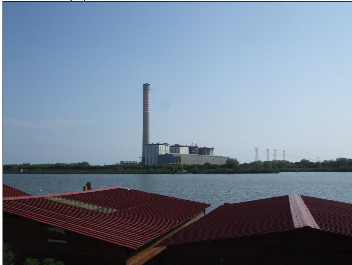
Punto di vista n.5 (pila) : stato di fatto