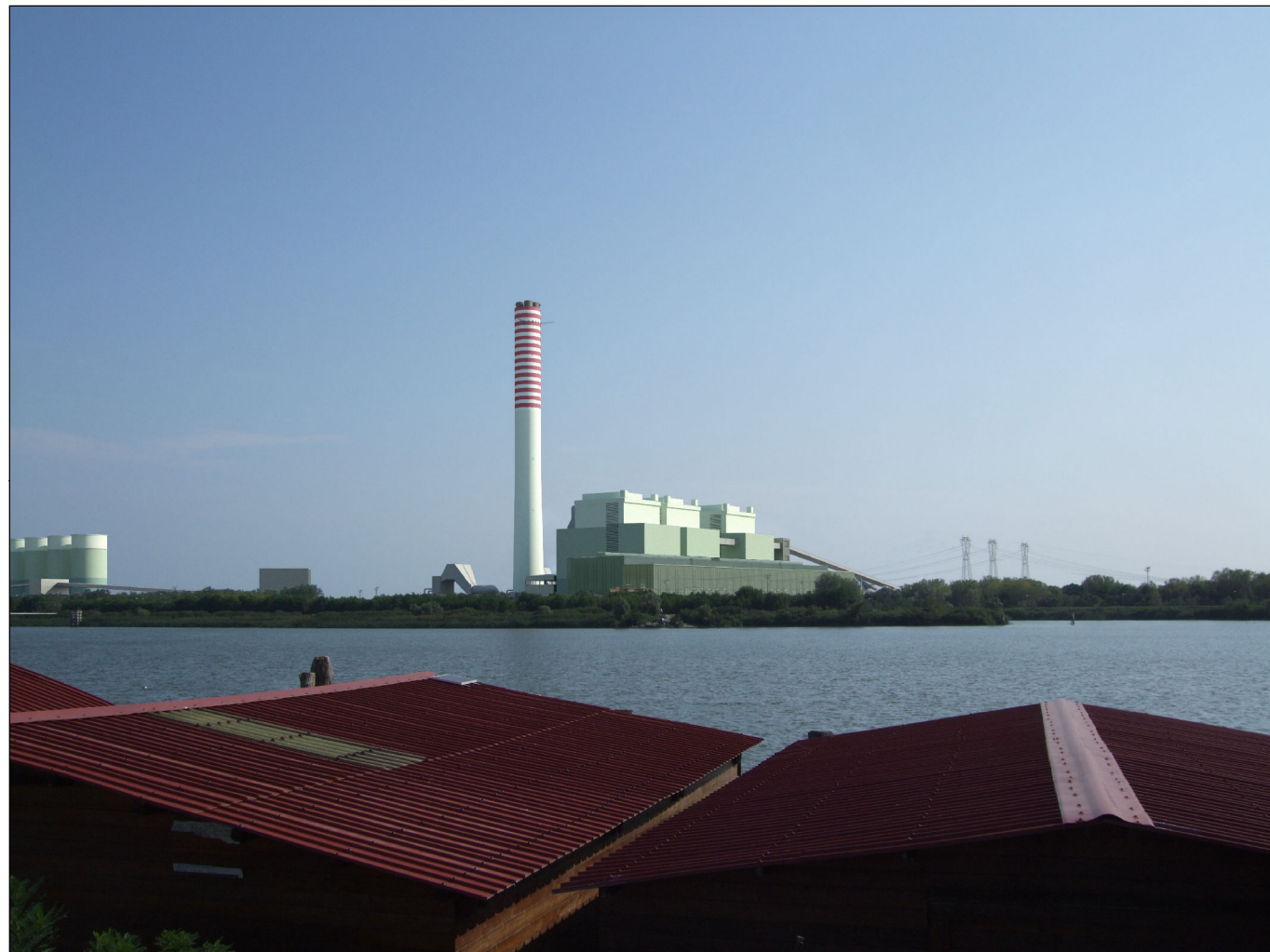
Punto di vista n.5 (pila) : simulazione d'inserimento paesaggistico