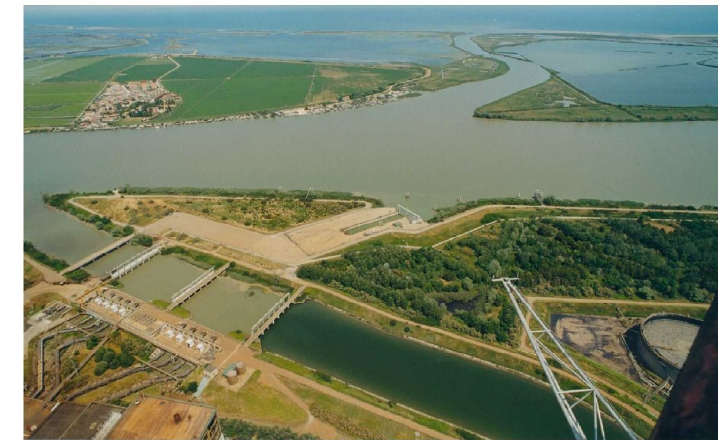
Canale di presa e Darsena