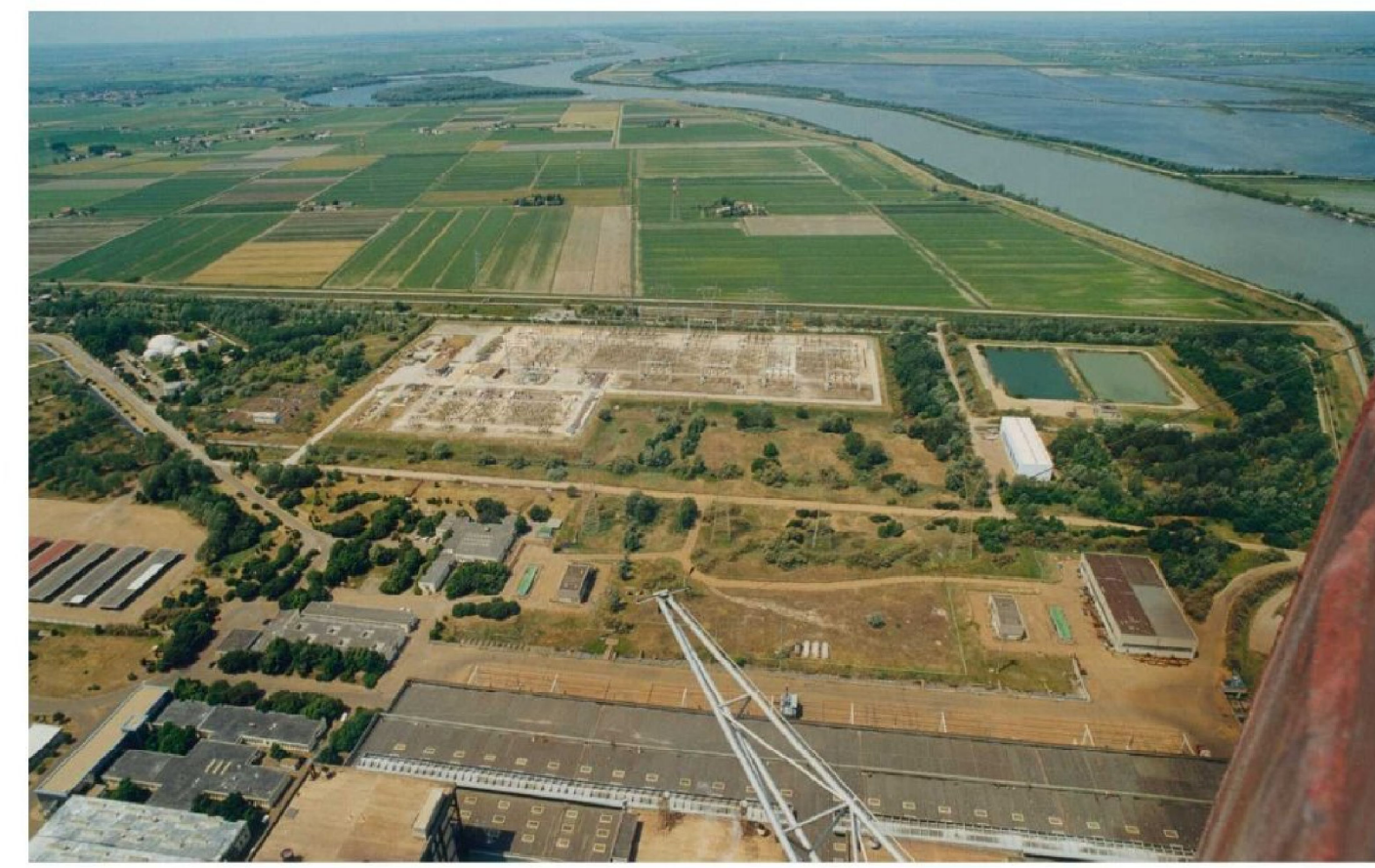
Stazione elettrica e bacino riserva e pompe acqua grezza