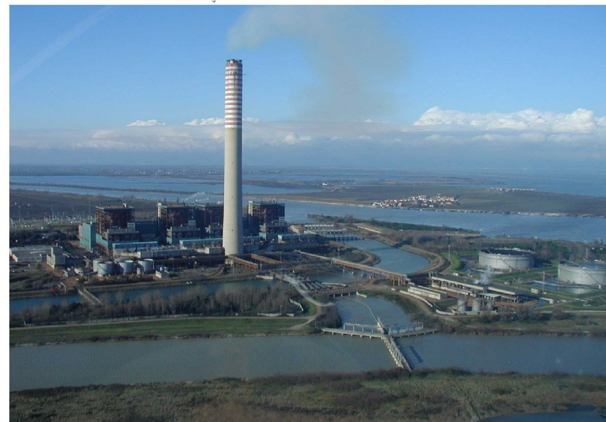
Vista complessiva della centrale da est