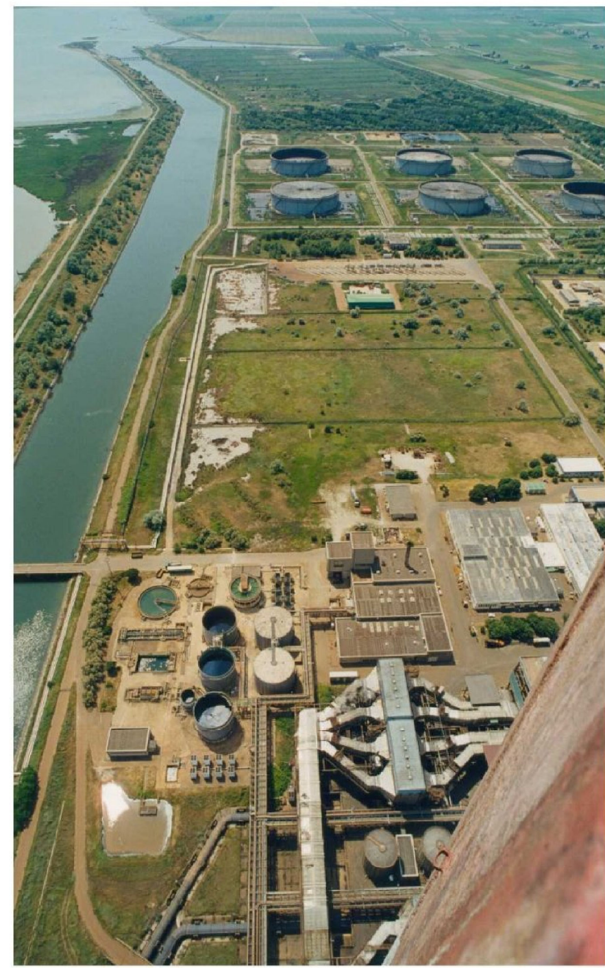
Parco combustibili sud, Edificio demineralizzatore e fabbricati di servizio