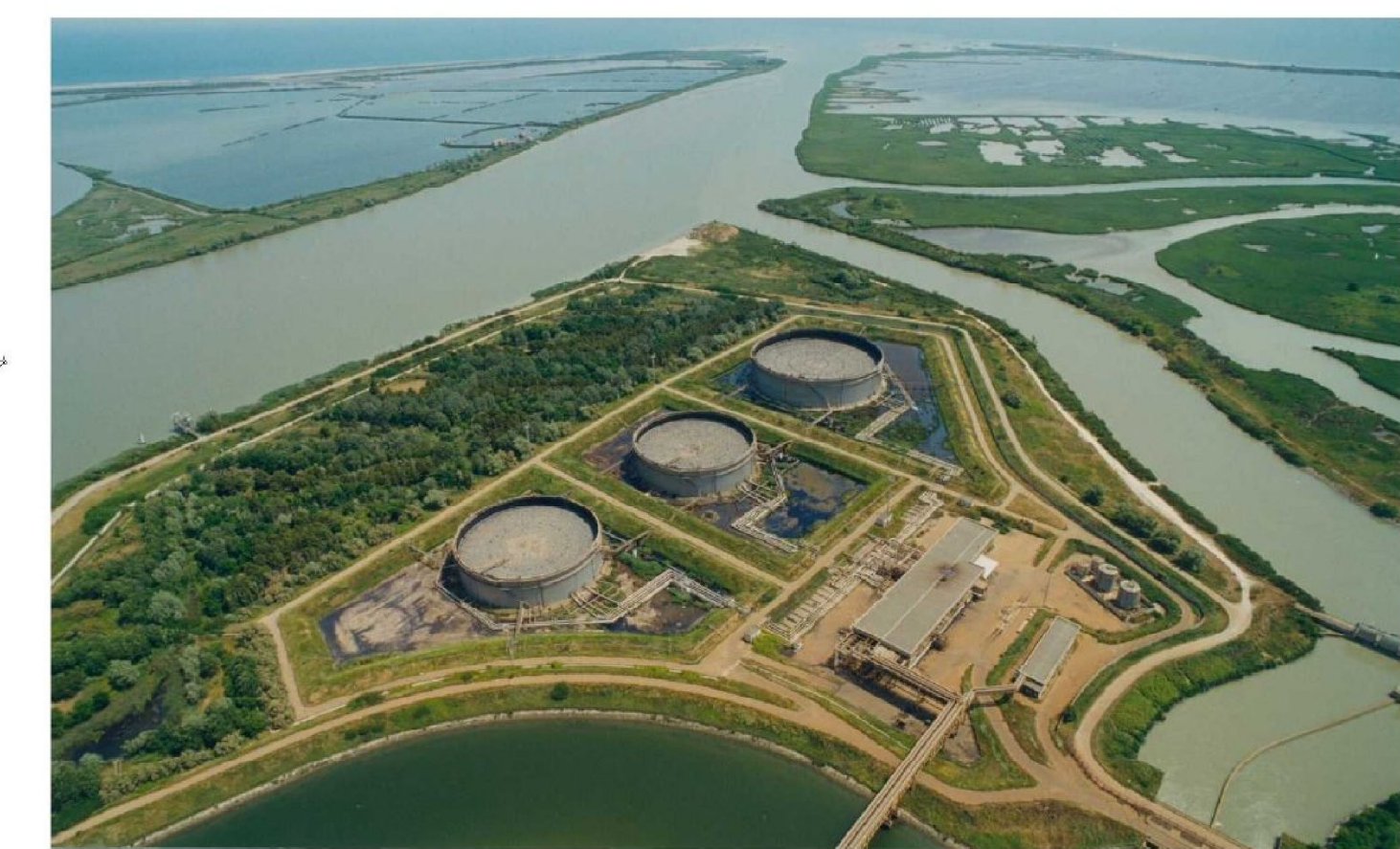
Parco Combustibili Nord e Canale di restituzione