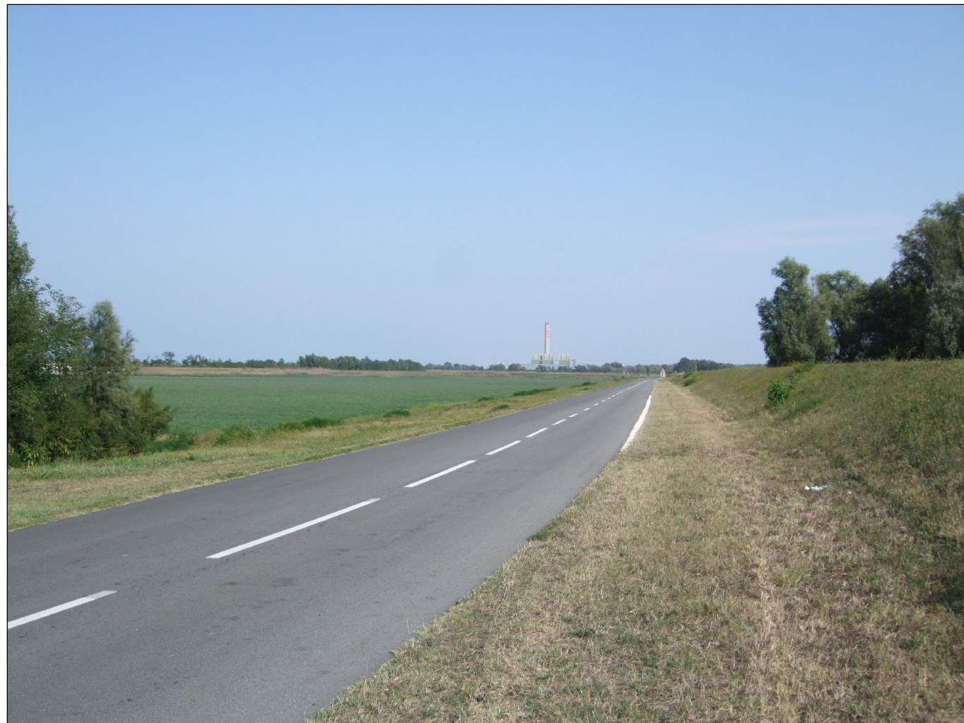
Punto di vista n.1 (Cà Zuliani) : simulazione d'inserimento paesaggistico