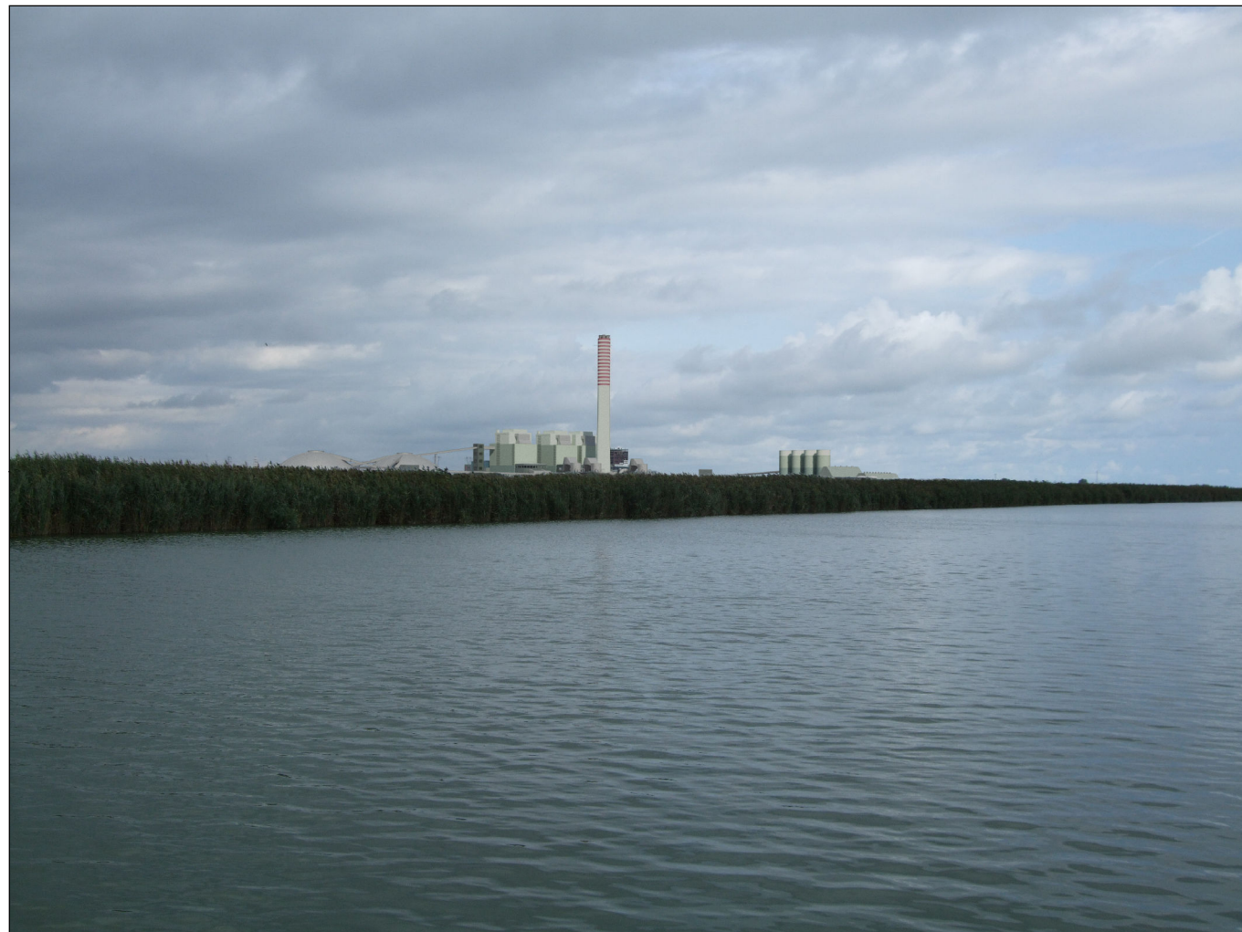
Punto di vista n.2 (canale) : simulazione d'inserimento paesaggistico