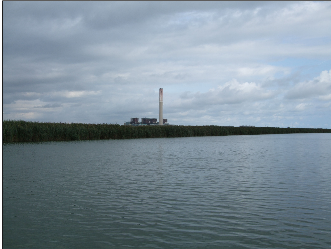
Punto di vista n.2 (canale) : stato di fatto