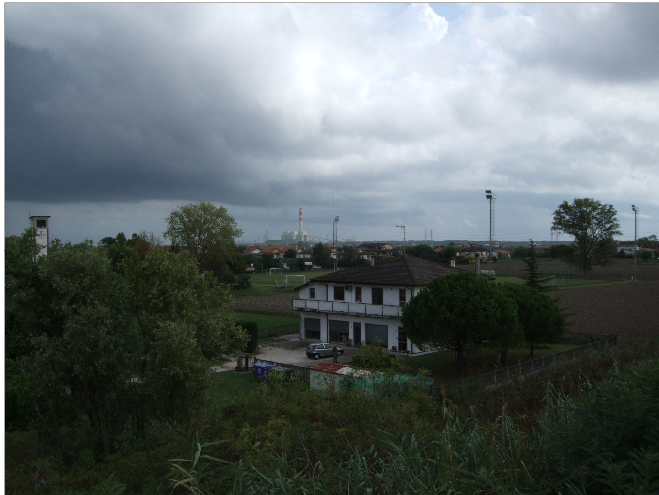
Punto di vista n.4 (ponte) : simulazione d'inserimento paesaggistico