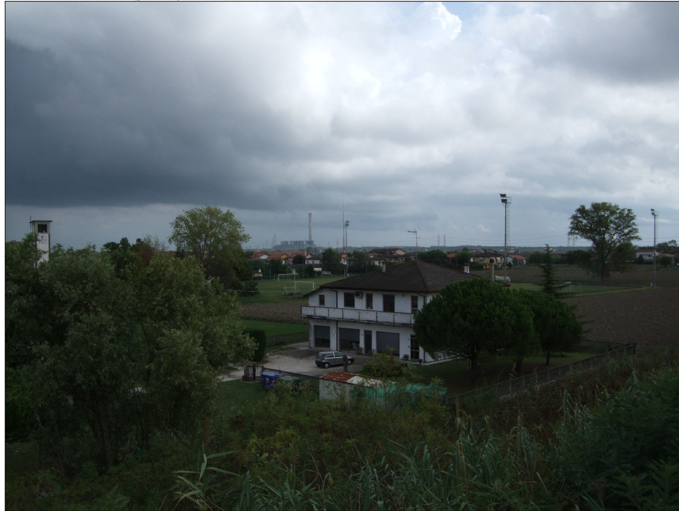
Punto di vista n.4 (ponte) : stato di fatto