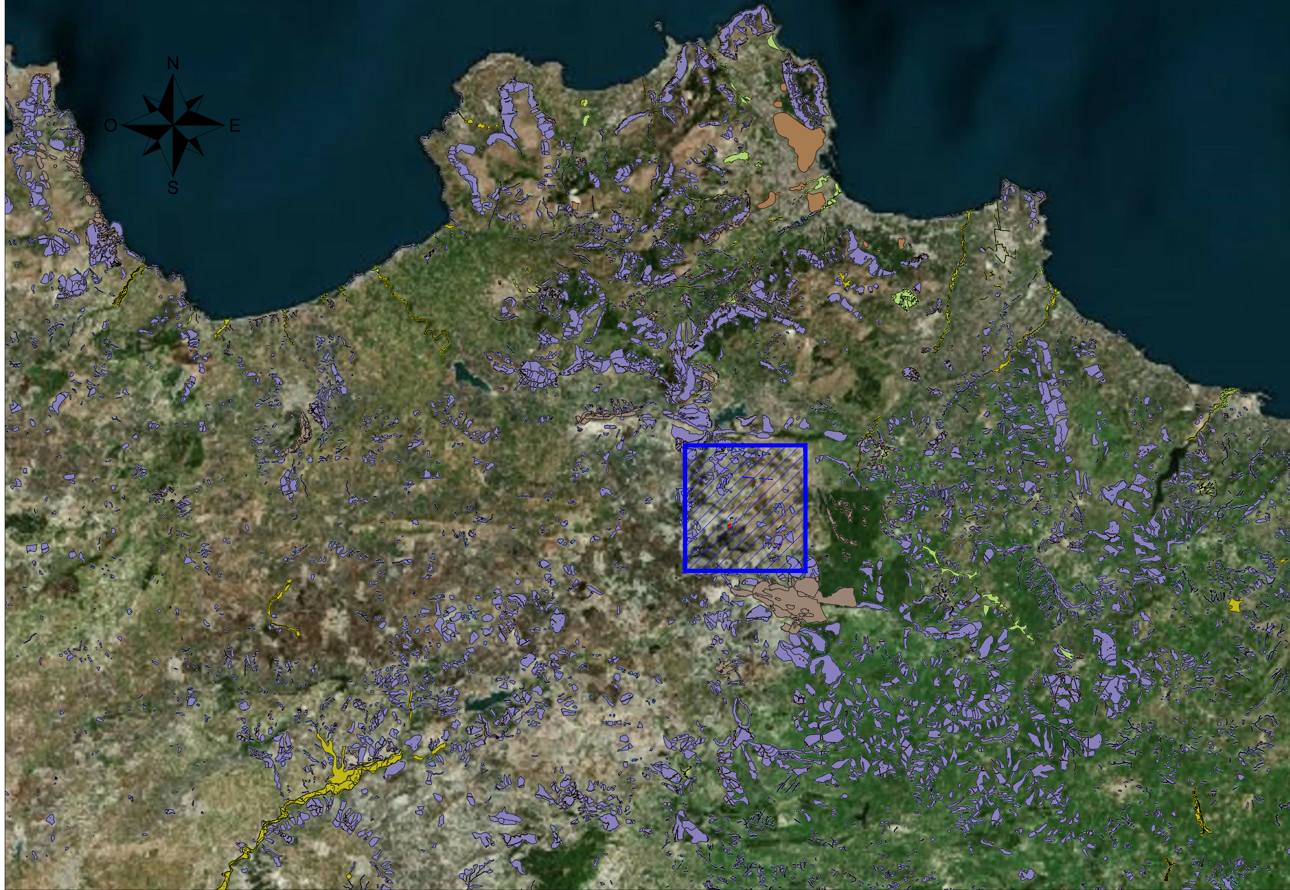
Inquadramento generale - Scala 1:250000