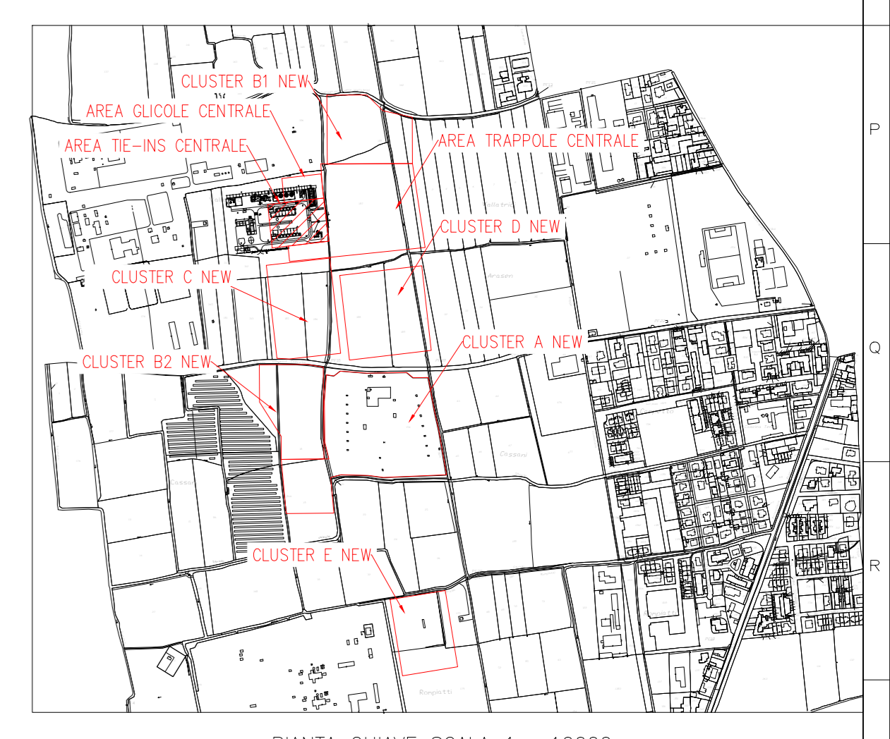
PIANTA CHIAVE SCALA 1 : 10000