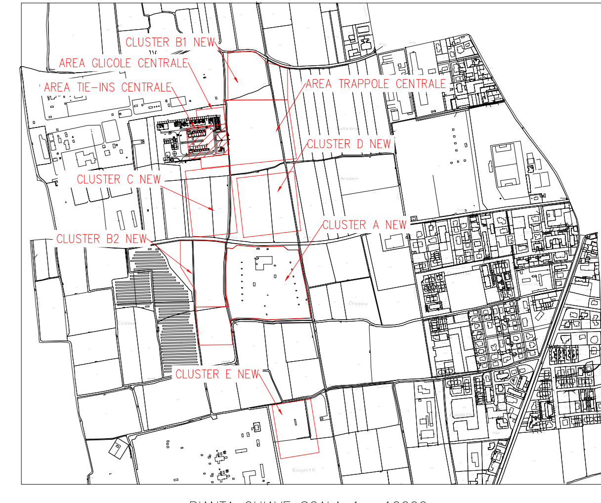
PIANTA CHIAVE SCALA 1 : 10000