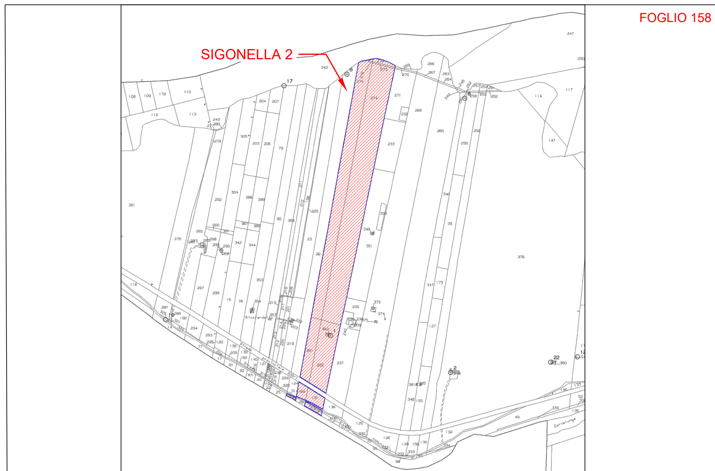
INSERIMENTO MAPPA CATASTALE AREA DI INTERVENTO SCALA 1:10.000