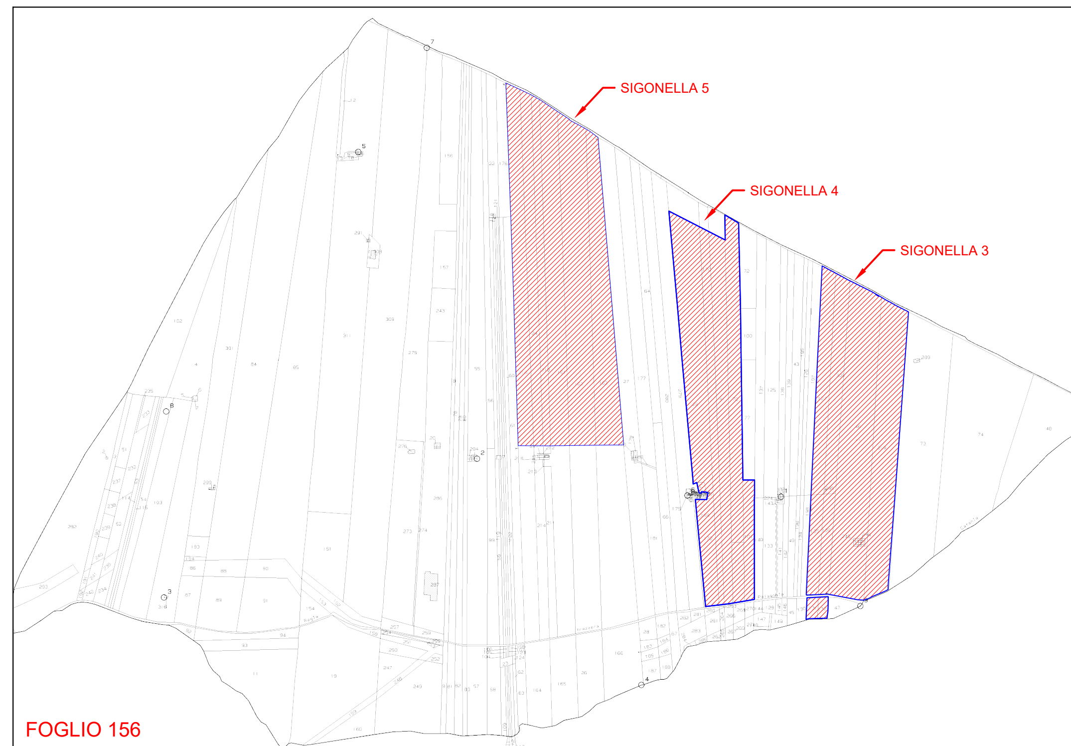
INSERIMENTO MAPPA CATASTALE AREA DI INTERVENTO SCALA 1:5.000